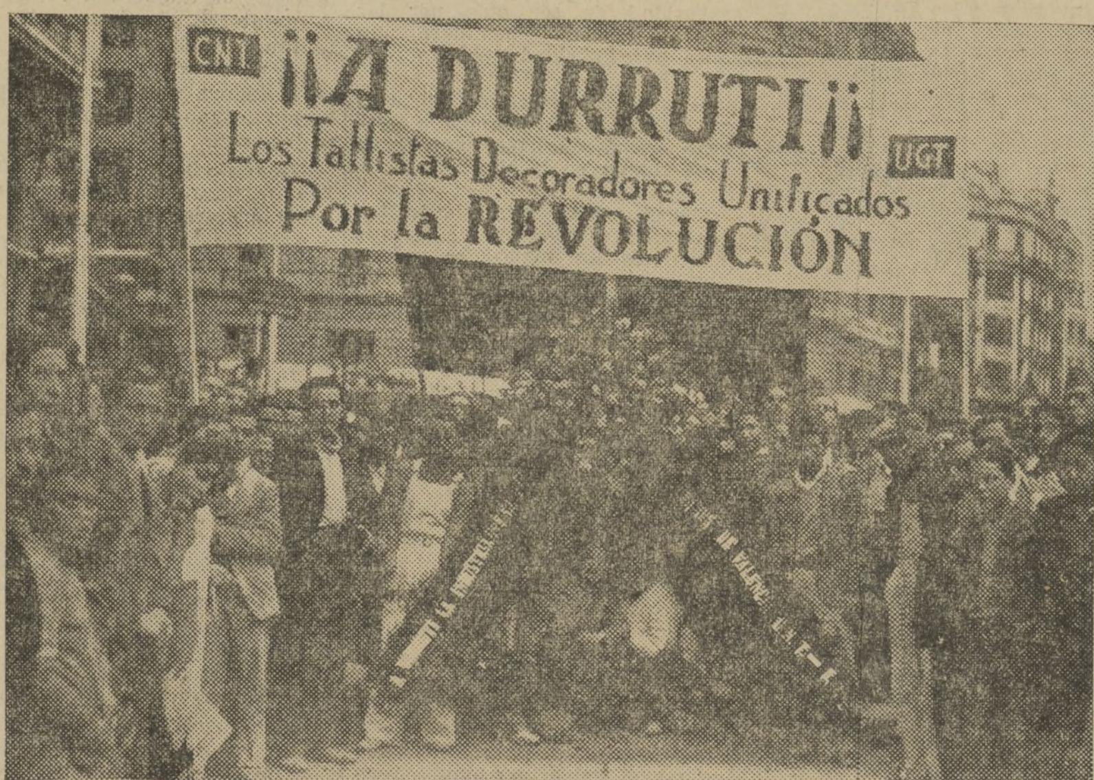
HE AQUÍ UNA DE LAS PRUEBAS DEL HOMENAJE POSTUMO QUE LOS TRABAJADORES VALENCIANOS TRIBUTARON AYER A DURRUTI

Han desfilado los partidos con sus respectivas banderas y han sido ofrendadas grandes coronas