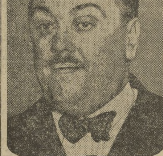
El señor Martínez Barrio, presidente de las Cortes republicanas, que ayer se reunieron en Valencia

si seguimos mereciendo su confianza. El presidente del Consejo termina su discurso con un ¡Viva la República!, que es contestado por todos los presentes con gran entusiasmo. Los aplausos y los vitores duran largo rato. Las últimas palabras de Largo Caballero tienen un tono de honda emoción que hace asomar a sus ojos unas lágrimas que son de ofrenda a los caídos y demostración de los sentimientos humanitarios que no perjudican el fervor de la lucha y el propósito firme y la fe en la victoria final.