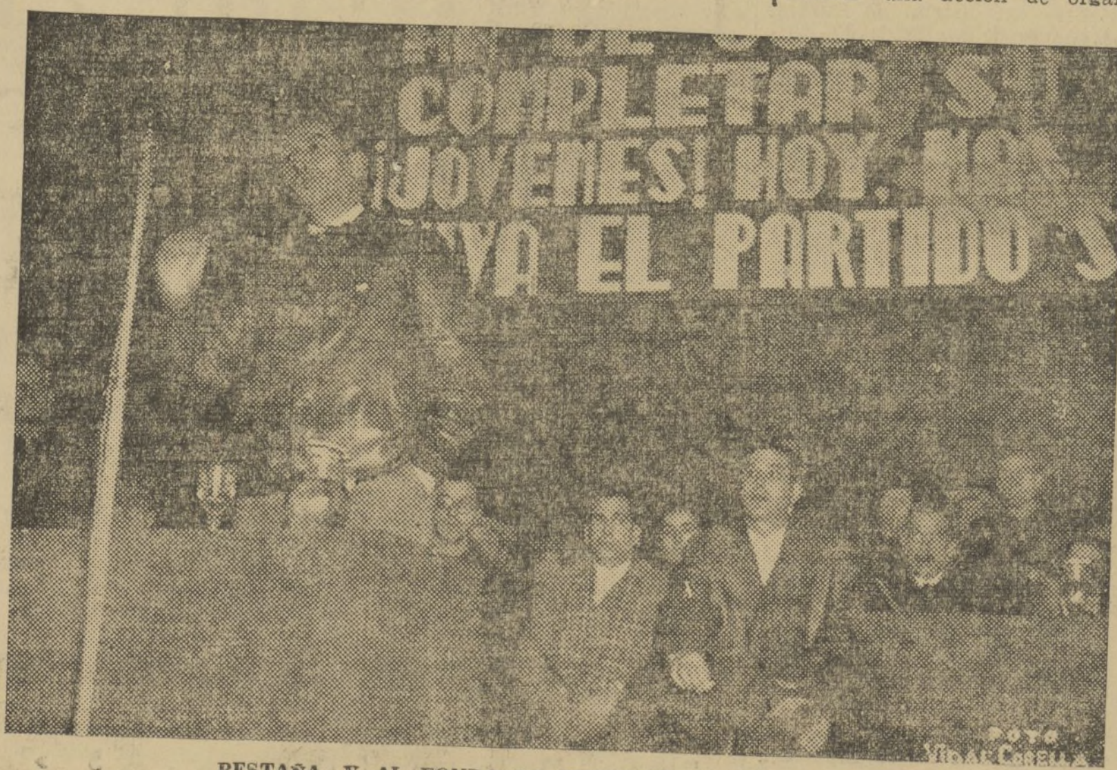
PESTAÑA, Y AL FONDO LA PRESIDENCIA DEL ACTO

Indudablemente que cuando uno se separa de la familia de que ha formado parte, se produce un cierto rozamiento, se establecen ciertas fricciones que resultan un tanto desagradables al final. Nuestra separación de los medios comunitarios de la C. N. T. y del anarquismo, produjo esas fricciones. Se nos dijo de todo, se nos censuró de una forma dura y de una manera cruel. Se emplearon contra nosotros todos los calificativos, hasta el de traidor. Se nos dijo que habíamos vendido nuestra fe revolucionaria por una cartera de ministro o quizá por un acta de diputado. Soportamos con