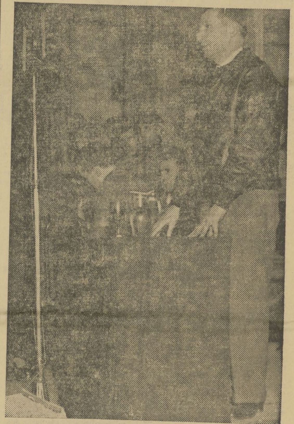
UNA ACTITUD DE ANGEL PESTAÑA DURANTE SU DISERTACION DE ANTEAYER EN APOLLO

el problema es difícil, pero el problema no es insoluble. Nace esta desviación del pensamiento, de posiciones personales que en muchos casos no han sido suficientemente meditadas y sobre todo, en Valencia. Aquí se ha trabajado a la masa obrera desorbitando todos sus pensamientos y desorientando la por completo del movimiento sindical. Porque aquí, en un período no muy lejano —hace de esto apenas