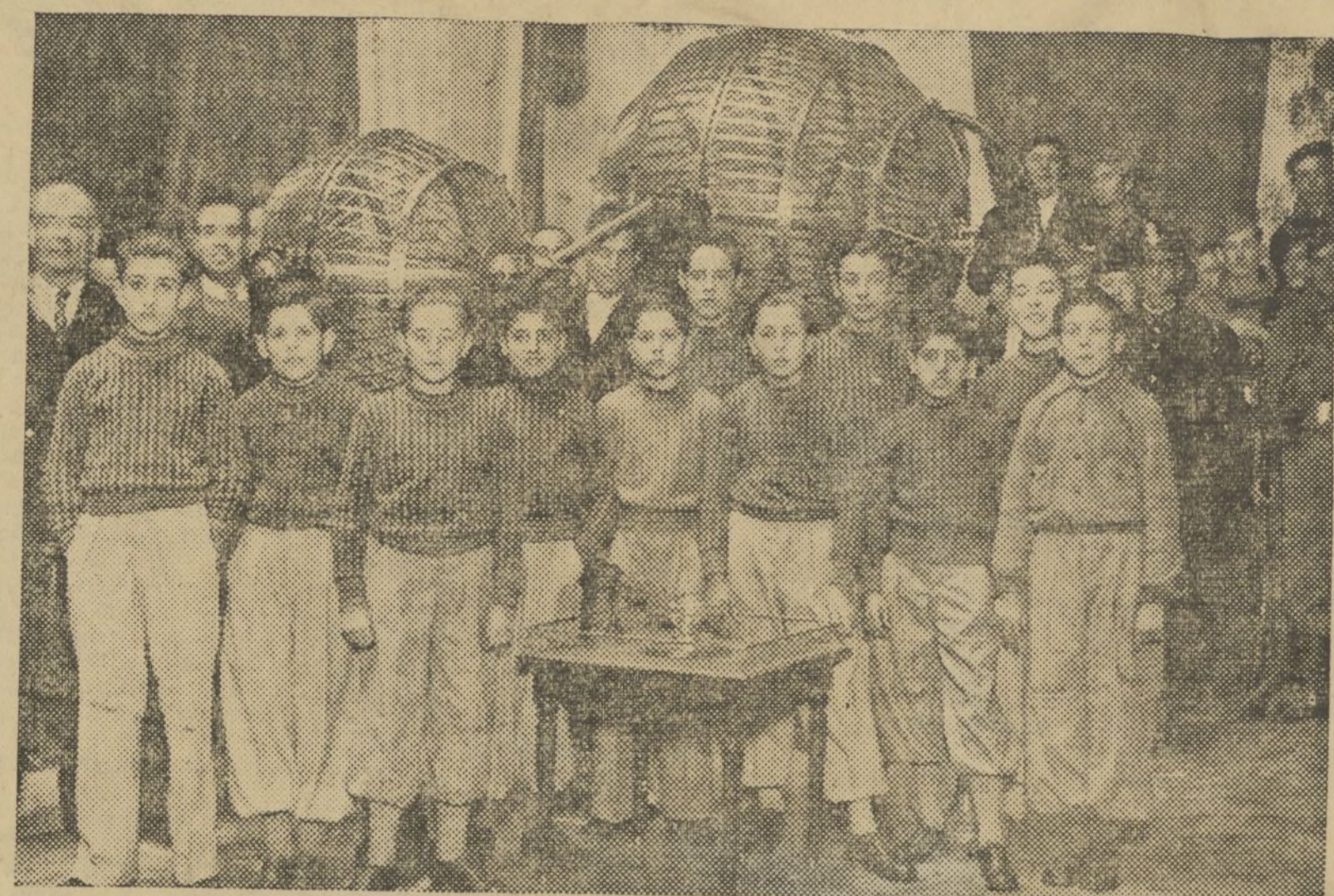
LOS NIÑOS DEL COLEGIO FERRER GUARDIA QUE CANTARON LOS NUMEROS DEL SORTEO DE LA LOTERIA DE NAVIDAD

Por primera vez en la historia de la Lotería española, desde que fué fundada en 1763, se celebró ayer el sorteo denominado de Navidad, en Valencia, habiéndose trasladado aquí parte del personal y útiles de trabajo de este departamento del Estado.