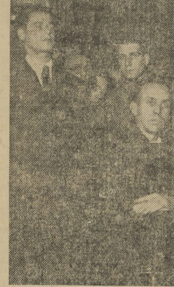
EL MINISTRO DE ESTADO, ALVAREZ DEL VAYO, DURANTE SU DISCURSO DE AYER TARDE, EN OLYMPIA

tuía para que no se disparase contra nosotros, ya que el hido llevaba, naturalmente, las insignias fascistas. En Málaga nos tributaron un recibimiento emocionante, y de Málaga nos trasladamos a Valencia para ponernos a las órdenes del Gobierno legítimo de la República. Estableció la comparación —re-