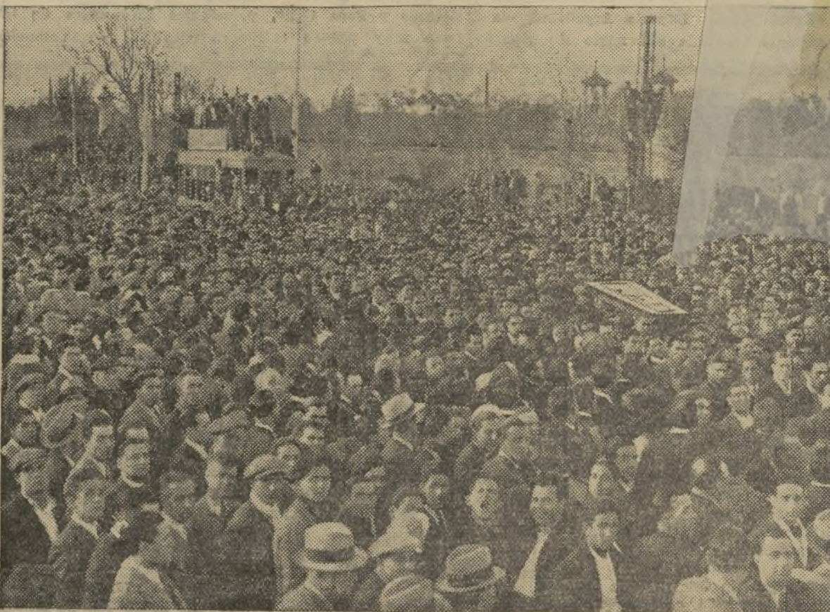
LA COMITIVA Y FERETRO A SU PASO POR EL PUENTE DE ARAGON

Entre ellos figuraban todos los concejales por el distrito del Pu