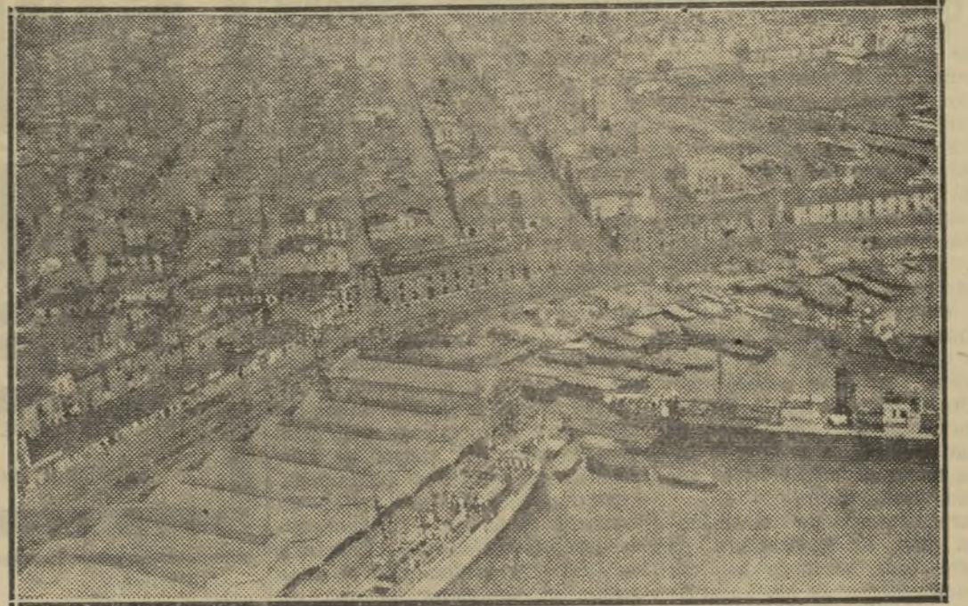
OTRA VISTA DEL PUERTO DE VALENCIA