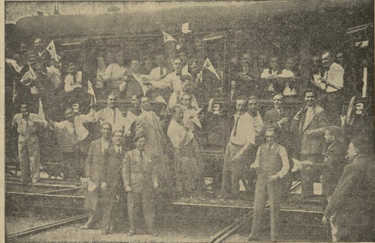
EL PRIMER TREN ESPECIAL SALIÓ A LAS 11'15 DE LA MAÑANA, LLEVANDO CERCA DE 1.500 AFICIONADOS ENTUSIASTAS. LA FOTO ES UN DOCUMENTO ACREDITATIVO DE COMO IBAN LOS COCHES

Como detalle que indica la modestia de sus jugadores y que po-