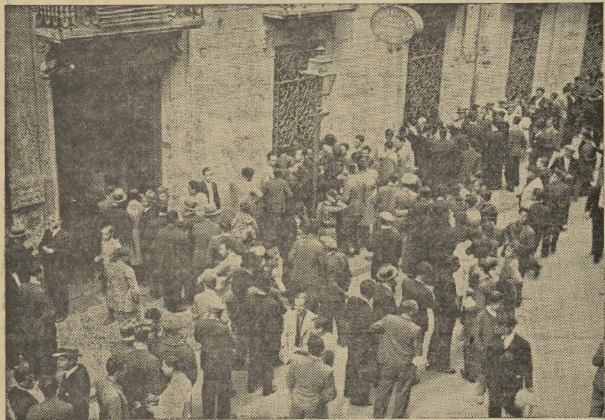
LAS TAQUILLAS DEL VALENCIA F. C. VIERONSE DE LA MANERA QUE MUESTRA LA FOTO, DURANTE ESTOS ÚLTIMOS DÍAS

cos: el Madrid; el Valencia con zapatos nuevos y luchando a zarpazos para escalar la última cuesta del campeonato copero; el Valencia objeto de mil atenciones y simpatías por parte de la afición. No salimos de nuestro asombro. Y es que la vida es así.