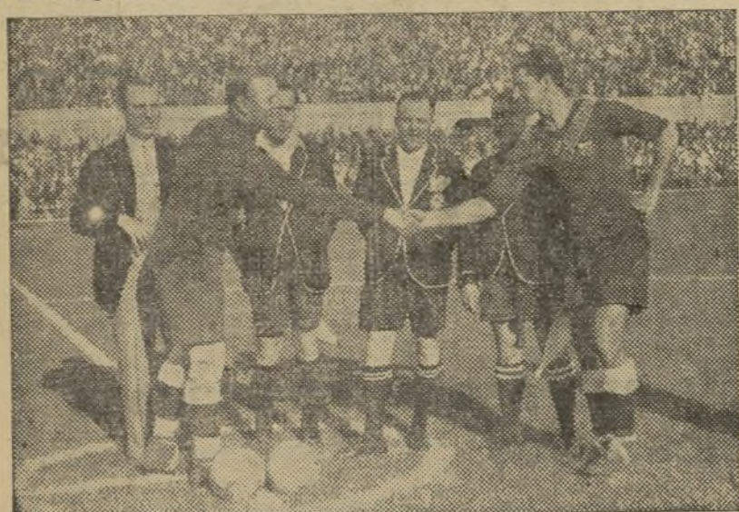
Valencia y Madrid, fueron representados por Zamora y Pasarín, dos nombres que van unidos en las páginas más brillantes del fútbol español

Todo lo cual se hace público para conocimiento de los ganaderos, criadores, recienadores, uarios y tratantes de ganado, o continuación a los anuncios insertados en el «Diario Oficial» este ministerio de 8 de Abril último, «Gaceta» y Prensa de Madrid, Mayo de 1934.