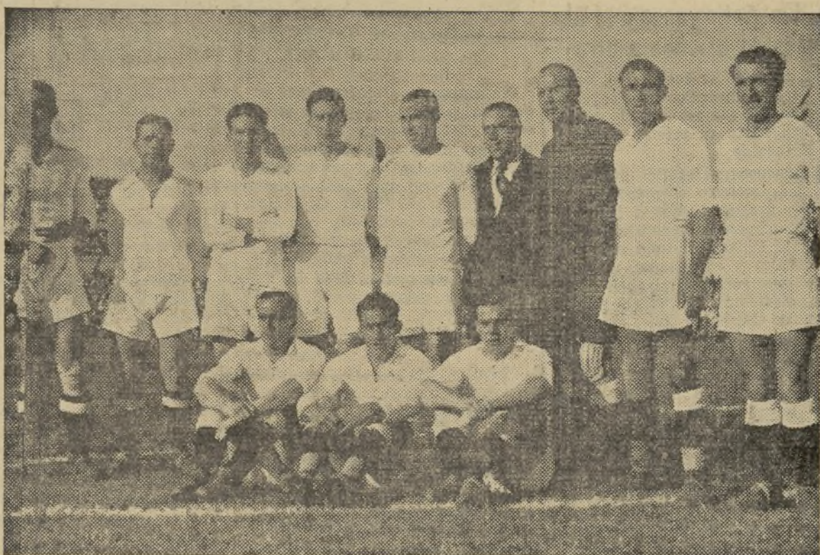
EL MADRID CAMPEON DE ESPAÑA

I Olimpic de Játiva fué eliminado gracias a la parcialidad del árbitro.--Miles de entusiastas valencianos llevaron a Montjuich el aplauso y el aliento de Valencia para los suyos