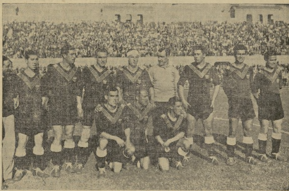
EL VALENCIA F. C. FINALISTA Y DIGNO RIVAL DE LOS NUEVOS CAMPEONES

Magnífico partido, en líneas generales, del Valencia. Dado como víctima propiciatoria en la cual se iban a cebar sin esfuerzo alguno