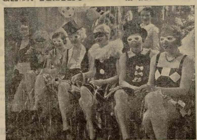
Una escena de «M. ñana estreno»