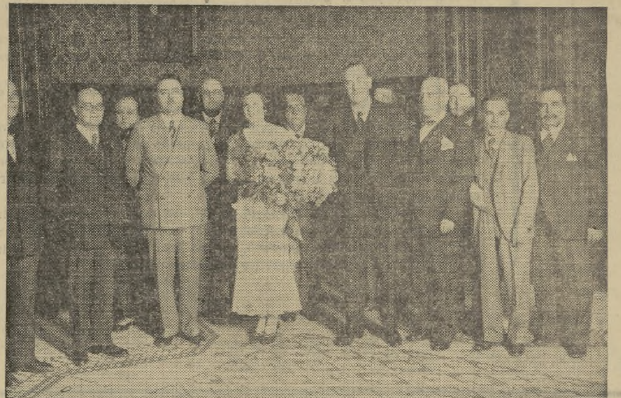
DESPUES DE LA CEREMONIA OFICIAL, MISS VALENCIA, ACOMPAÑADA DEL ALCALDE, CONCEJALES Y PRENSA, POSEA ANTE EL OBJETIVO DE LAZARO

Es nuestro deseo que la bella representante de Valencia obtenga un triunfo lisonjero en Madrid.