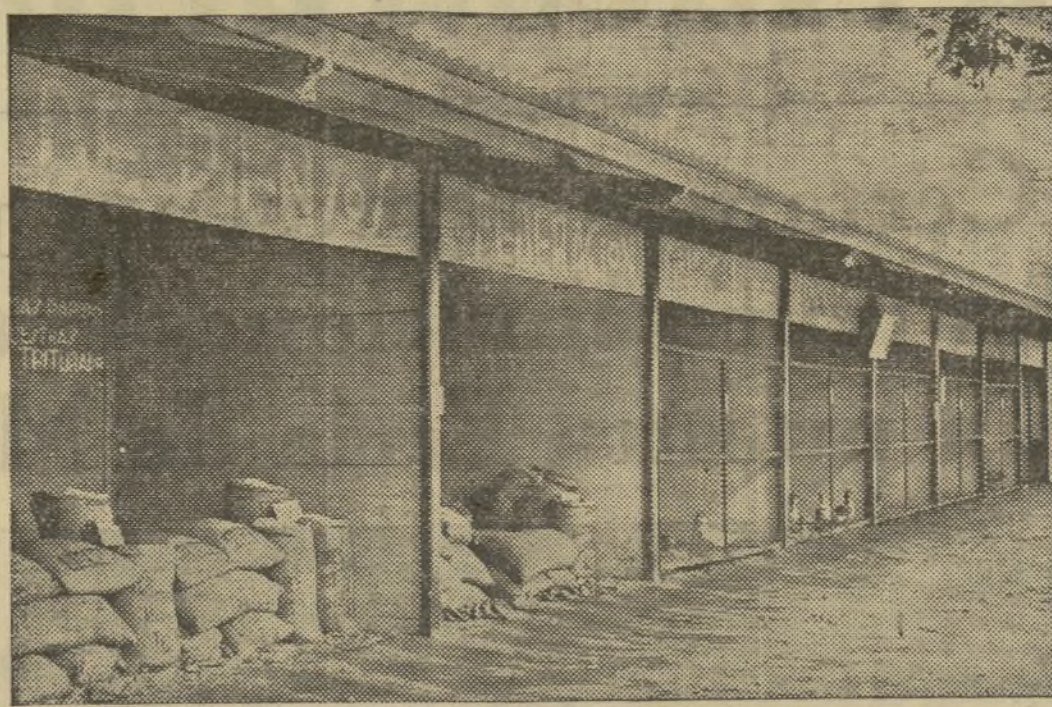
STAND QUE LA FEDERACION SINDICAL DE AGRICULTORES ARROCCEROS PRESENTA EN LA FERIA MUESTRARIO

La gran labor desarrollada por la Federación Sindical de Agricultores Arroceros en propaganda y beneficio del cultivo y exportación de esta gramínea, ha tenido un nuevo marco de propaganda en nuestro Certamen internacional.