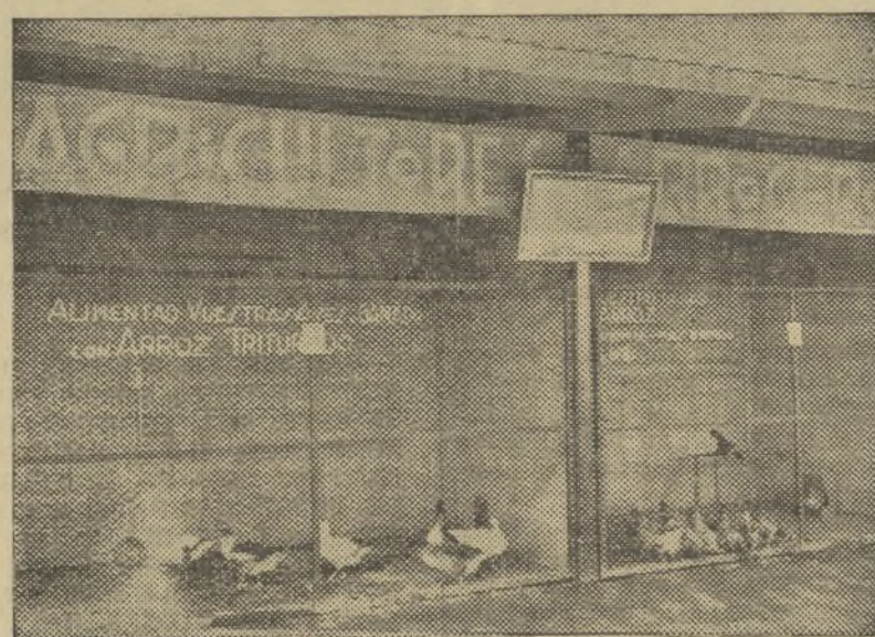
VISTA DE OTRO DE LOS STANDS QUE EN LA FERIA PRESENTA LA MISMA FEDERACION

do halagadores elogios de ellos por el numeroso público que circula sin cesar por frente de ellos. Nuestra cordial felicitación a la junta de la Federación Sindical por tan feliz iniciativa.