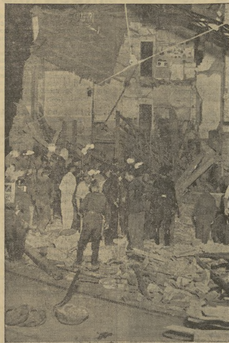
EL ESTADO EN QUE QUEDO EL INMUEBLE A POCO DE OCURRIR LA CATASTROFE

se hallaba consumiendo su frugal cena en el momento de la catástrofe.