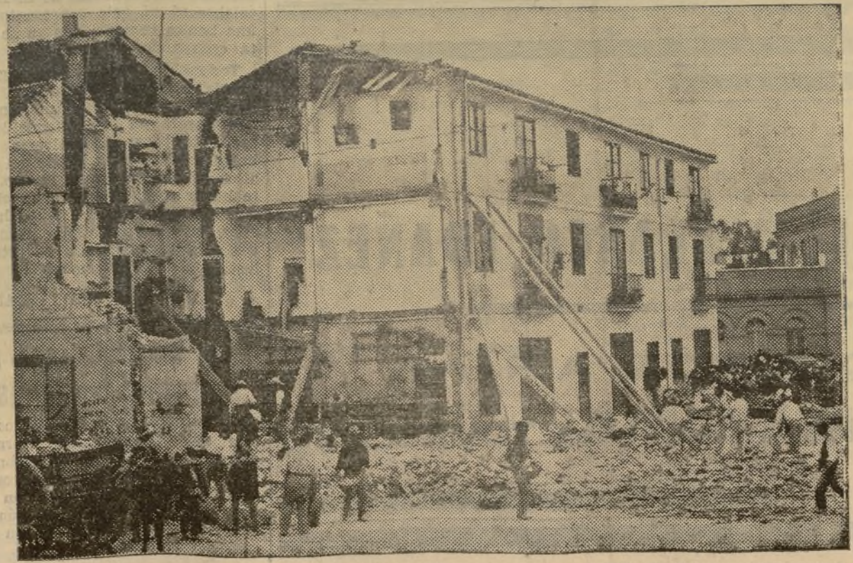
VISTA DEL LUGAR QUE OCUPABA LA CASA HUNDIDA, DURANTE LOS TRABAJOS DE DESCOMBRO