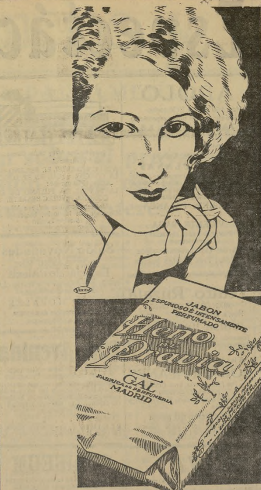
PERFUMERÍA GAL. - MADRID. - BUENOS AIRES

Birmingham.—Se ha celebrado un combate de boxeo para el campeonato inglés del peso welter en