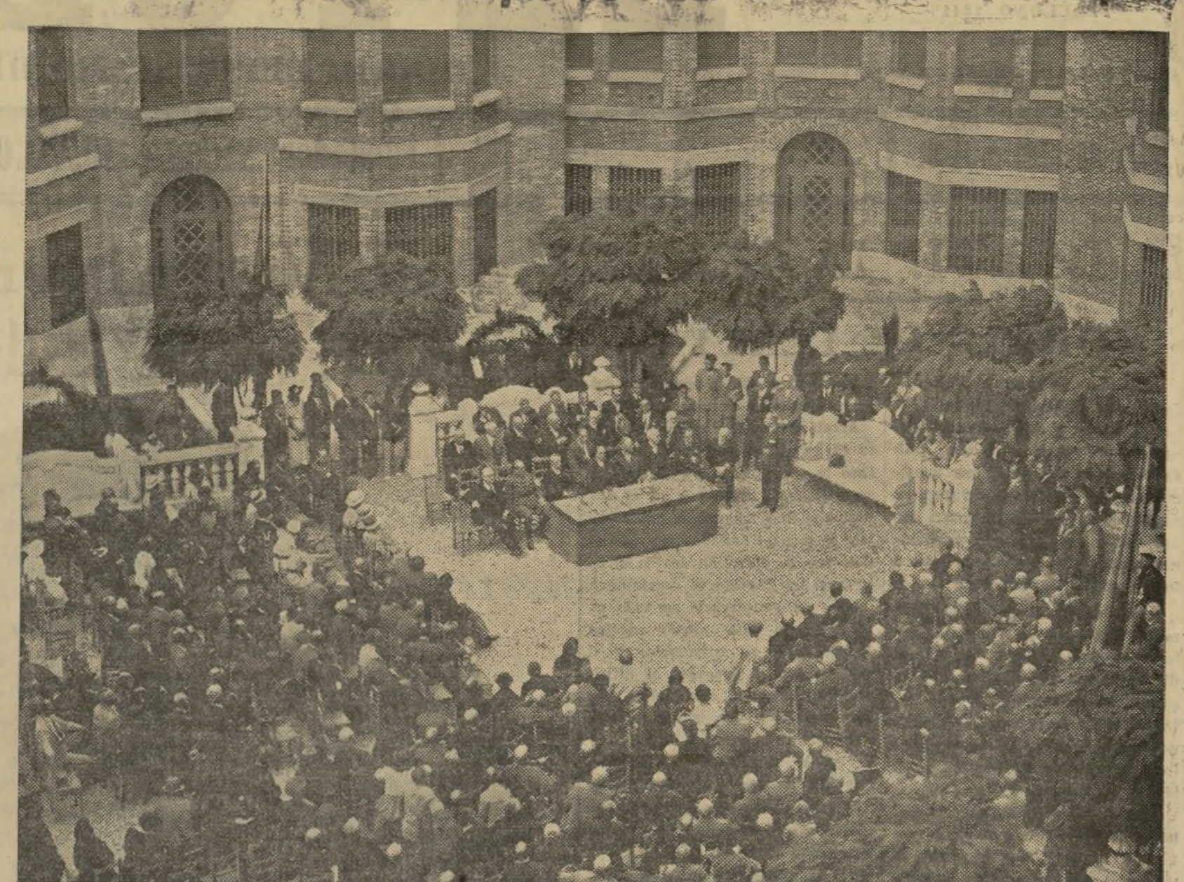
PRIMER REPARTO DE 68.000 PESETAS REALIZADO POR LA CAJA DE PREVISION SOCIAL, ENTRE LOS ANCIANOS QUE CUMPLEN 65 AÑOS DURANTE LA ANUALIDAD DE 1933, CUYO ACTO SE CELEBRO EN EL PATIO DEL GRUPO DE CASAS BARATAS QUE POSEE DICHA CAJA EN EL CAMINO DE JESUS