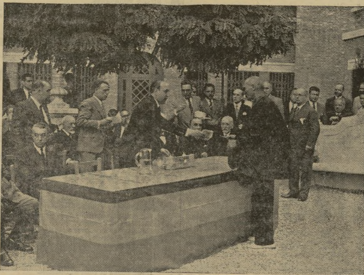
EL GOBERNADOR SEÑOR TERRERO HACIENDO ENTREGA A LOS ANCIANOS DE LA CANTIDAD QUE LES HA CORRESPONDIDO EN EL REPARTO DE 68.000 PESETAS REALIZADO POR LA CAJA DE PREVISION SOCIAL

De la VII Asamblea nacional de Cajas de Ahorro de España