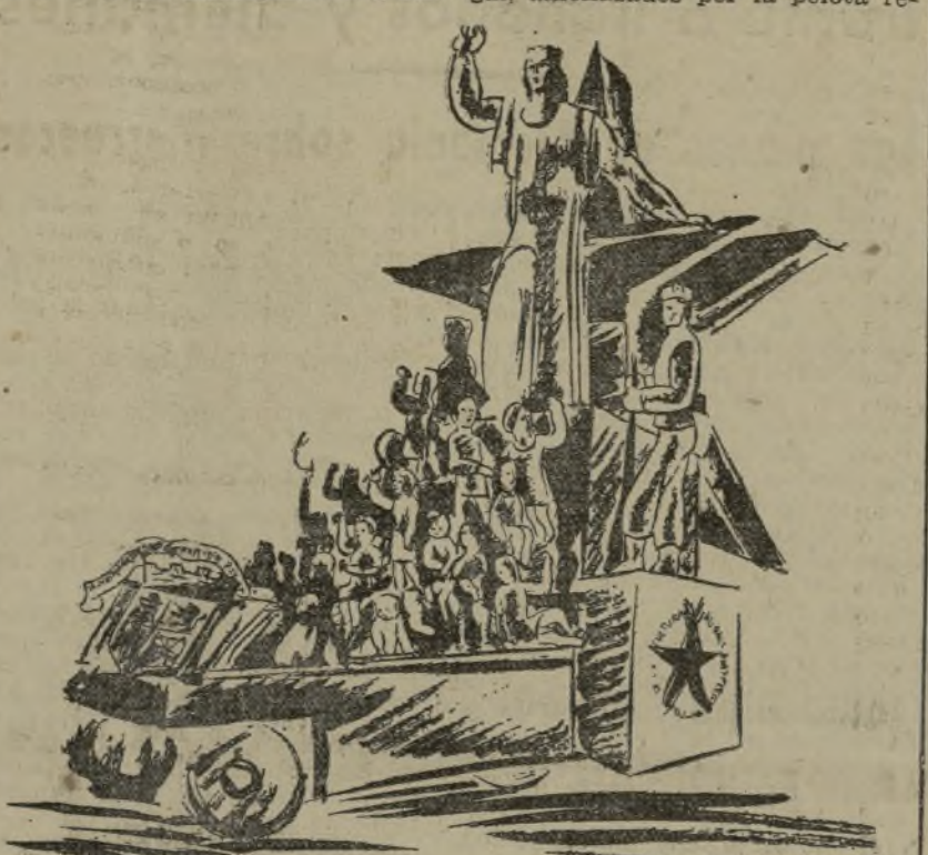
DETALLE DE UNA DE LAS CARROZAS QUE FIGURARAN EN LA CABALGATA DE MAÑANA DOMINGO

fascioso general Franco, tristemente célebre, el terror de los pequeños) y un juego de bolos, en el que los palitroques son los «representantes» de los requetés, falanges, Italia, Alemania y Portugal, amenazados por a pelota re-