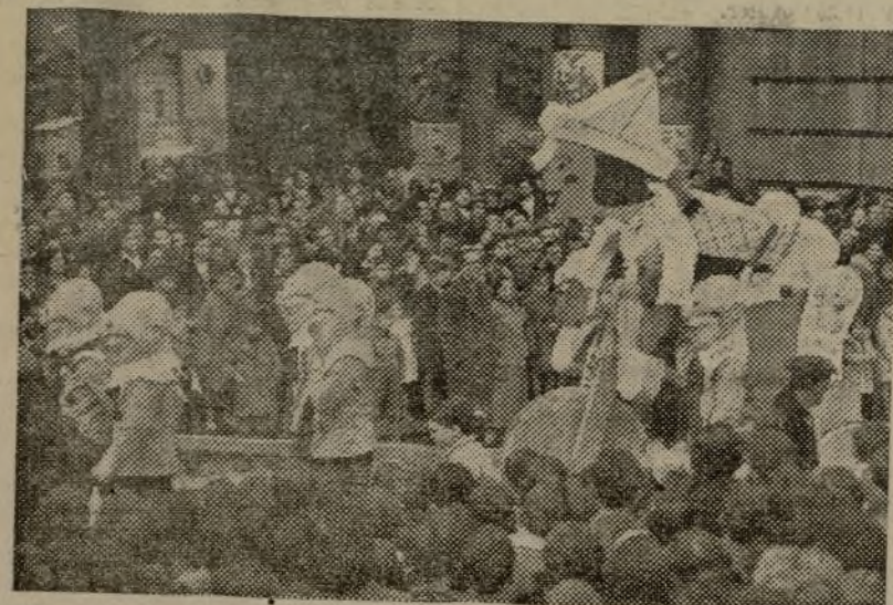
«Pipos», sobre su triciclo, camina leguas y leguas en pos de una de sus maravillosas aventuras, quién sabe si para liberar a sus compañeros víctimas de algún encantamiento

Caballero y sobre él, escrito, el saludo del pueblo al jefe del Gobierno de la República española. Seguían numerosos grupos de niñas, que llevaban ramos de flores, gaya ofrenda de los jardines valencianos. Una miliciana a caballo ondeaba la bandera de la República, a la que daban guardia sesenta milicianos. Unos labriegos iban después, portando ramos de naranjas y limones. Y, seguidamente, cuarenta huertanos a caballo representaban a los pueblos de la región de Valencia que más se han distinguido en el envío de viveres a los frentes de combate, para el ejército de la Libertad. Luego, las grupos típicas de la tierra valenciana, con los vistosos trajes regionales.