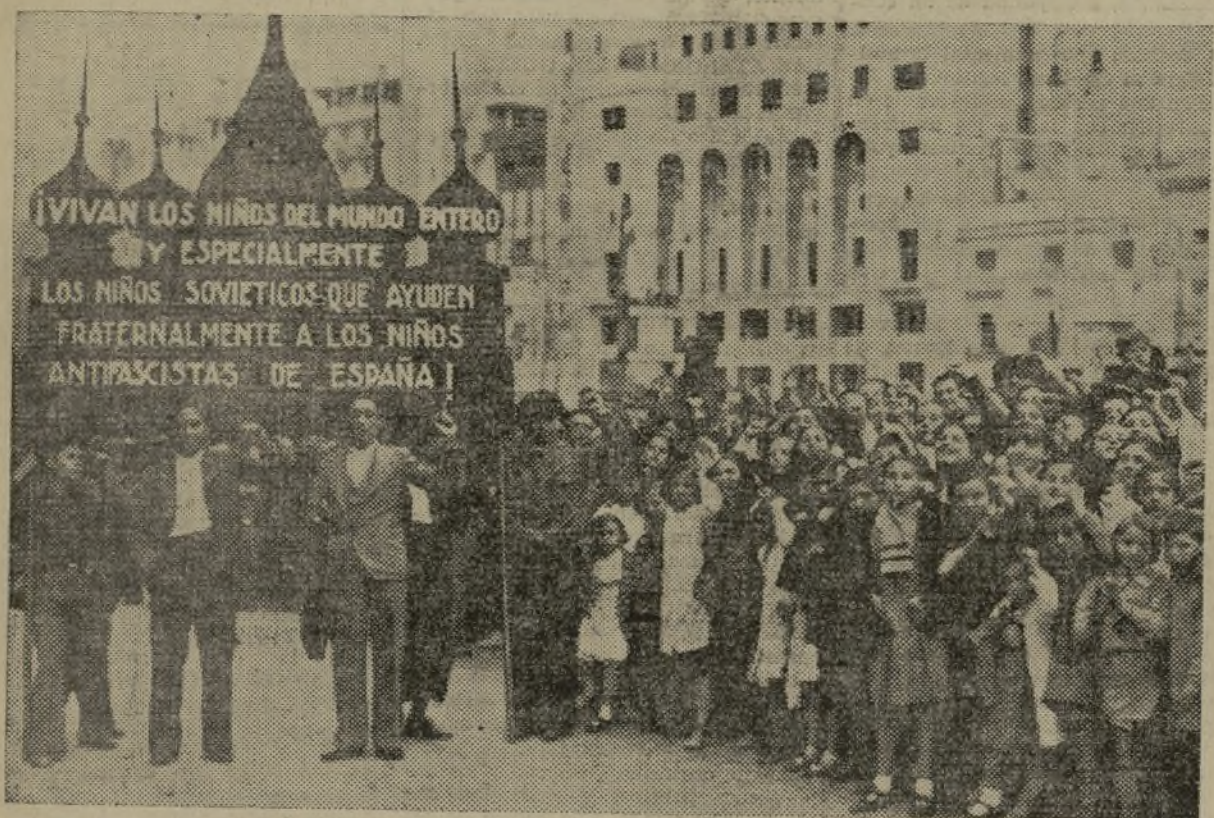
Con este pancarta en honor de los niños «del mundo entero», comenzó el desfile de la lucida cabalgata del domingo

Hubo algunas modificaciones en la composición de la cabalgata,