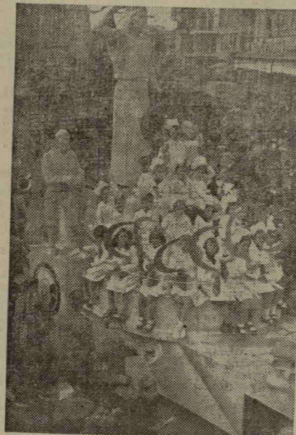
Las dos carrozas finales: una, representando el triunfo de nuestra nación, sostenida por el Trabajo; la otra, simbólica también, representa a la U. R. S. S., en su decidida ayuda a España Antifascista