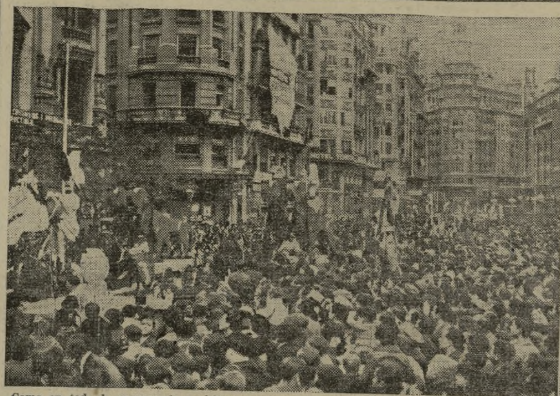
Como en toda la carrera, la multitud entusiasta, invadió la Avenida de Blasco Ibáñez y la plaza de Castelar, para presenciar el magnífico desfile de la cabalgata, con que el ministerio de Instrucción dió por terminados los festejos de la Semana del Niño Antifascista