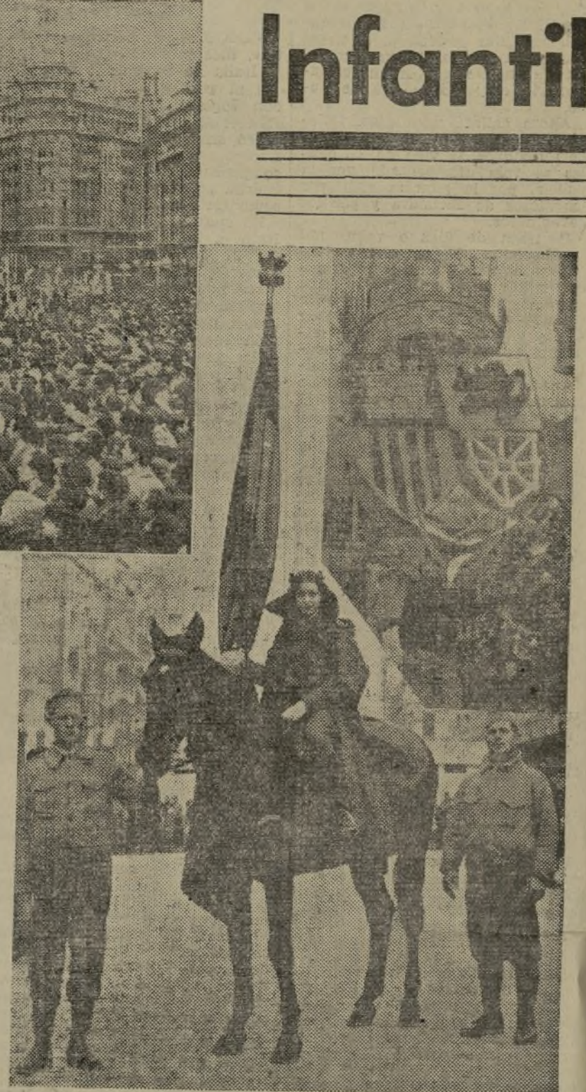
He aquí la carroza España y la figura simbólica de nuestra nación antifascista, en pie de guerra, representada por una bellísima mujer

Finalmente, entran en nuestro capítulo de elogios, la Alianza de Intelectuales Antifascistas y el Sindicato d'Art Popular, afecto a C. N. T., al desarrollar maravillosamente la visión de este festejo. (Unos en la parte técnica, añadiendo o quitando lo que a su