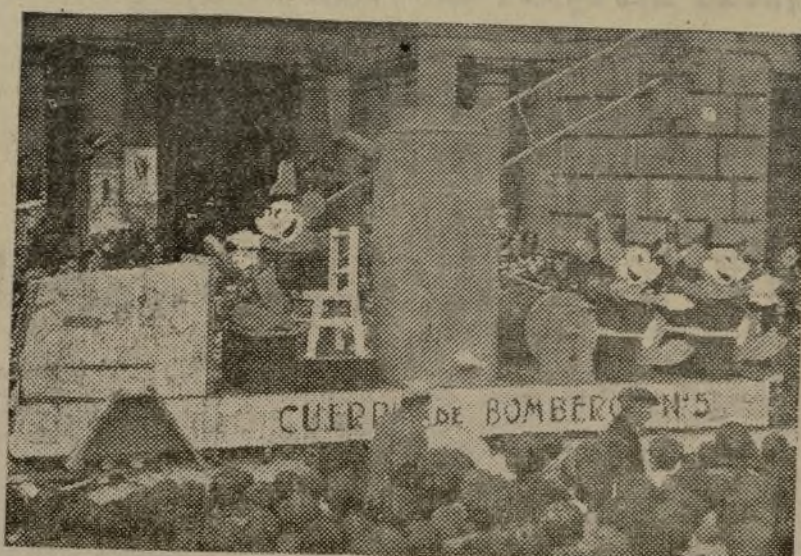
«Mickey», es el héroe de la jornada. Con su carro de incendios, provisto de los más «modernos» elementos, corre a salvar a su amada

Entre los que presenciaron el festejo, pudimos recoger la opinión de que debía organizarse una exposición de estos estándares y al finalizar ésta, que se lleve a cabo una subasta, cuyos ingresos podrían destinarse para algo útil, cuya iniciativa dejáramos a ese ministerio, que con tanto celo y cariño ha sabido llevar durante estos días, un poco de calor del lejano hogar a los pequeños evacuados y a los huérfanos de los que cayeron en el frente en defensa de nuestras libertades.