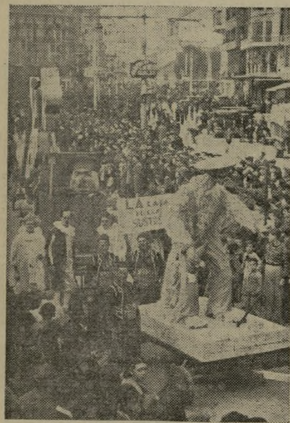
«El lobo feroz» y tras él «Pelut de caixeta», los siniestros y a la vez ridículos generales facciosos, Queipo y Franco, reducidos a ser el hazmerreir de todos. — «Los tres cerditos», grupo que llamó poderosamente la atención en el desfile, frente al Ayuntamiento, en cuyo balcón principal se encontraban los ministros de Propaganda e Instrucción pública, con el alto personal de ambos departamentos

con respecto a lo acordado, para darle al desfile mayores atractivos. Abrió marcha una sección de la guardia municipal montada, en traje de gala. A continuación, un pancarta con el busto de Largo