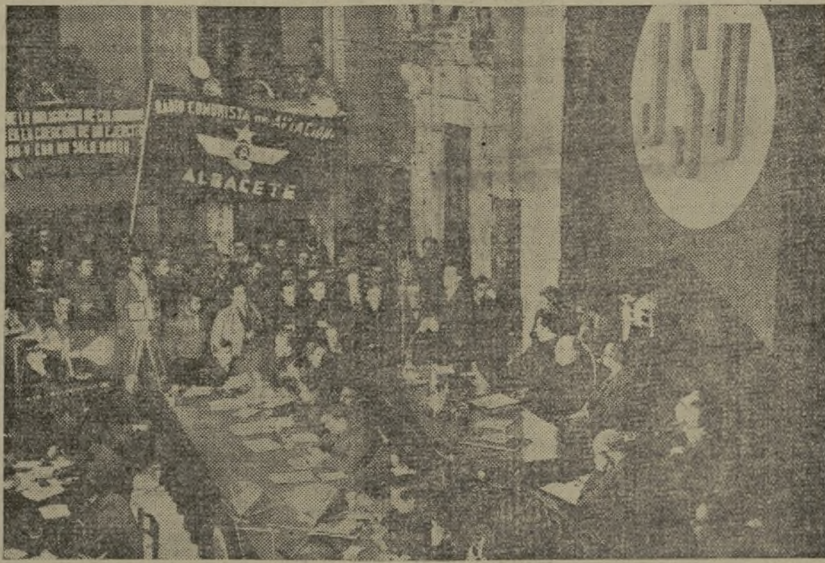
LA INAUGURACION DE LA CONFERENCIA NACIONAL DE JUVENTUDES REVISTO CARACTERES DE GRAN ACONTECIMIENTO

¡Adelante! Que encuentre la fórmula justa para crear una España grande y feliz con que la juventud ocupe el lugar que por derecho le corresponde. (Grandes aplausos.)