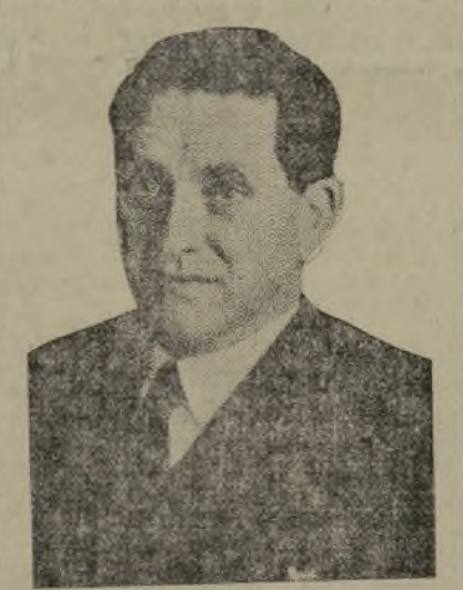
EL MINISTRO VASCO, MANUEL IRUJO

—Los republicanos — contesta Irujo — luchamos por el fuero de la democracia, los marxistas por los po-