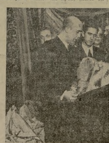
EL MINISTRO DE PROPAGANDA, SEÑOR ESPLÁ, ADMIRANDO UNO DE LOS RICOS Y ARTÍSTICOS TEJIDOS DE ESTA INTERESANTÍSIMA EXPOSICIÓN, ÚNICA EN SU GENERO, QUE HA DE RECORRER VARIOS PAISES DEL EXTRANJERO, COMO MUESTRA DE NUESTRO TRABAJO EN LA RETAGUARDIA

Buena parte de los tejidos que figuran en la Exposición se fabrican exclusivamente en Valencia y por medio de telares antiguos, en los que se trabaja a mano. En Lyon, donde en