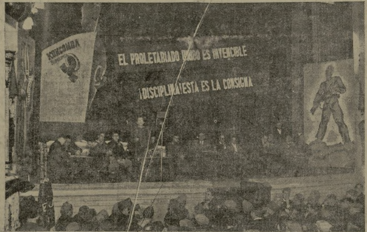
UNA VISTA GENERAL DE LA SALA EN DONDE SE CELEBRO EL ACTO PRO UN NUEVO «KOM-SOMOL» Y EN EL QUE INTERVINIERON LOS REPRESENTANTES DE LOS PARTIDOS POLITICOS Y ORGANIZACIONES SINDICALES

Termina diciendo que por la savia renovadora que el partido que representa lleva en sí, se puede contar con el mismo para todo, y mucho más para ayudar a la construcción del nuevo buque, hecho con el que se da una muestra de agradecimiento a ese pueblo