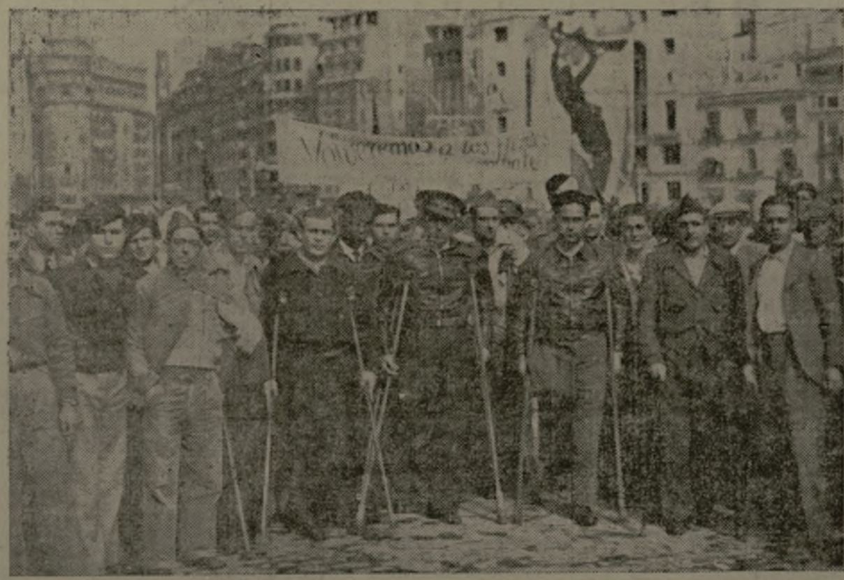
Entre los manifestantes, con ser todas las representaciones tan estimables y dignas de mención, hemos de destacar la en que figuraban estos inválidos y heridos de guerra... ¡Ciudadanos: por ellos, por una España libre y democrática, todos con decisión a las armas

La cabecera de la organización se colocó al pie del muro de la ciudadela y la manifestación siguió por la Pasarela, Alameda, puente del Real, Temple, Pintor López y Vicente Daudé, a la Presidencia del Consejo de ministros, en cuyos balcones aparecían el presidente del Gobierno, señor Largo Caballero, acompañado de los ministros de Justicia, Gobernación, Comunicaciones y de Estado.