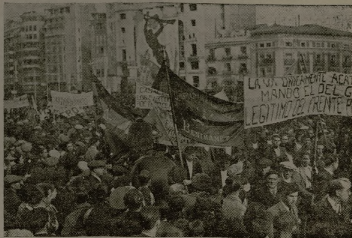
Un aspecto de la imponente manifestación en la que formaban representaciones del Frente Popular y las sindicales U. G. T. y C. N. T., que anteayer renovó al Gobierno la expresión de que recaiga en él la máxima y única autoridad

Puede calcularse que el número de personas que han concur-