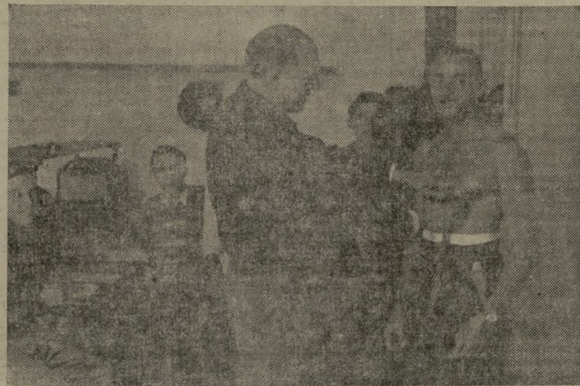
UNO DE LOS MEDICOS MILITARES DURANTE EL METRAJE DE LOS NUEVOS RECLUTAS

En el primer día de plazo se ha presentado más del ochenta y cinco por ciento de la totalidad de los movilizados