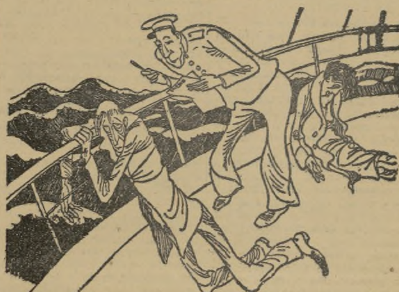
—Y EL SEÑOR, ¿QUE DESEA PARA EL ALMUERZO? ¿CABEZA DE VACA O...?

Segundo. — La agresión así proyectada, podía realizarse un submarino italiano, cuyos torpedos son iguales a los españoles, con lo cual, al recogerse dentro del casco del crucero alemán torpedos del torpedero disparado, se daba fuerza a la acusación contra nosotros. Tercero. — Quizá llegó a pensarse que era posible el torpedeo real sin peligro de hundimiento del buque agredido mediante la disminución de la carga de la cabeza de combate del torpedero y sustituyendo con arena u otra sustancia la parte sustraida para conservar el equilibrio de pesos del torpedero. Cuarto. — No creyendo eliminados todos los riesgos de hundimiento del «Leipzig», se desistió del aventuradísimo propósito, examinado a producir un «casus belli», quedando todo reducido a la falsa versión de unas agresiones inexistentes, de las que ningún tripulante del «Leipzig» llegó a enterarse.