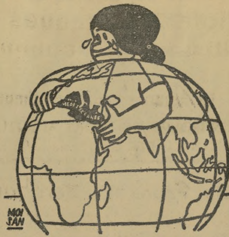
TODAVIA QUEDA ESTA LLAGA EN EL MUNDO