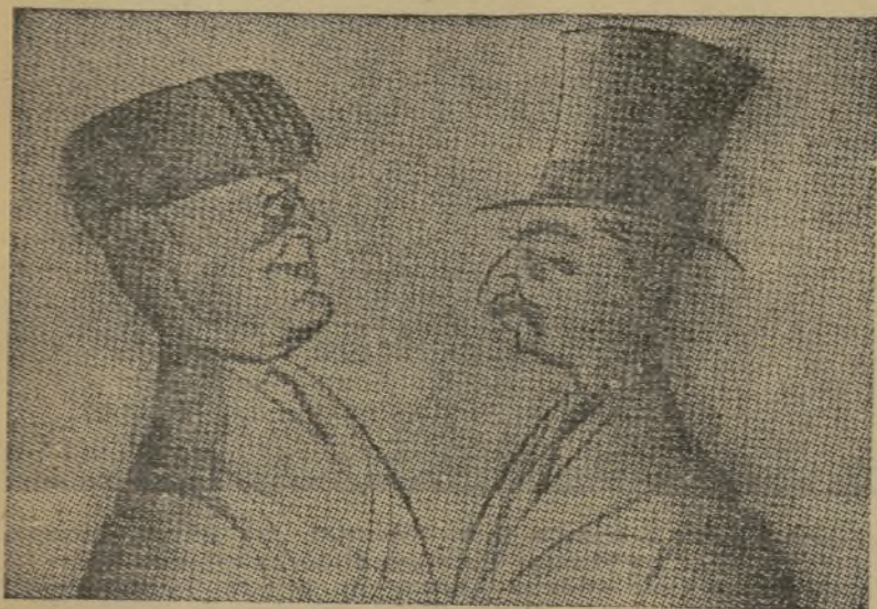
MUSSOLINI Y NEVILLE CHAMBERLAIN

Entretanto... Esperemos... En Septiembre se reunirá la S. D. N., se hablará una vez más del reconocimiento de la conquista de Abisinia, y se esperará la evolución de los acontecimientos españoles.