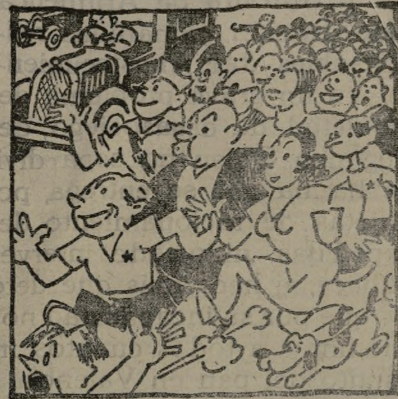
Se lanzan las multitudes por toda la población para ver la exposición que han hecho las juventudes.