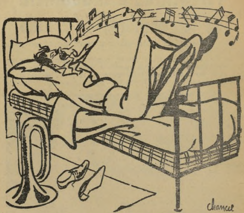
EL DIA DE DESCANSO DEL MUSICO