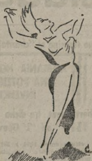
La danzarina checoslovaca, Mira Holzbajova, en su creación «Madame Europa».

El público que acudió el pasado sábado al teatro Alkazar a la sesión de danzas ofrecida por la danzarina checoslovaca Mira Holzbajova, se encontró con un espectáculo singular perfectamente encajado en la hora dramática del mundo y muy especialmente, en la hora de nuestro país. Con un espectáculo de sentido honda-