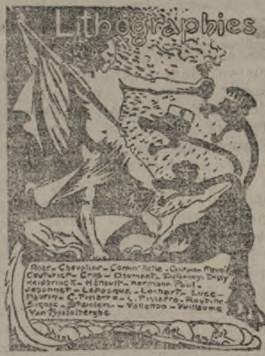
UN ANUNCIO DE «LES TEMPS NOUVEAUX» (Litografía de Signac.)

Hablé con Descaves, quien me sugirió la idea de tratar de este asunto, invirtiendo el título: «Regeneración del ejército por medio