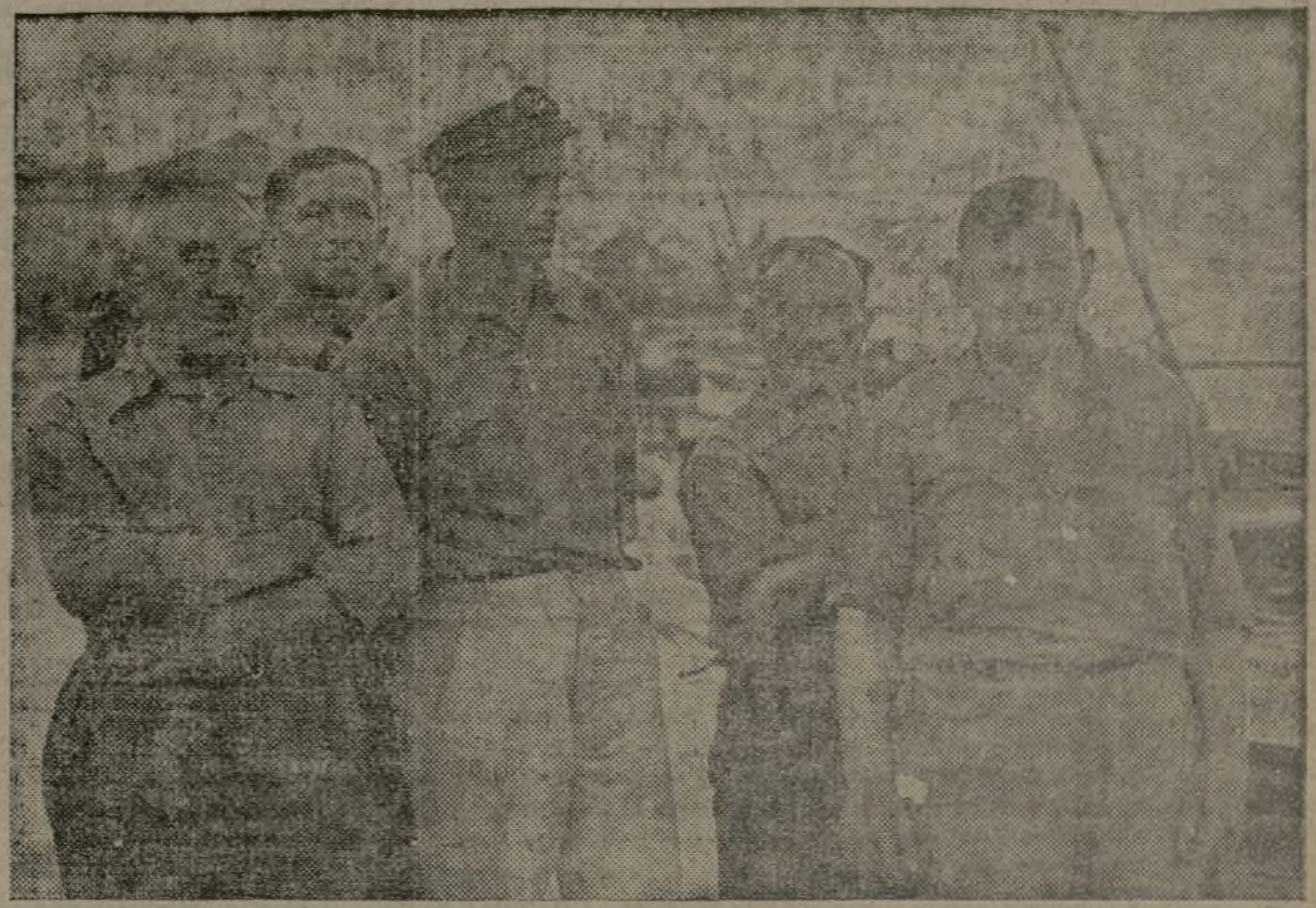
UN GRUPO DE SUPERVIVIENTES DEL PETROLERO INGLÉS «WOODFORD», A SU LLEGADA AL PUERTO DE BENICARLO. A LA DERECHA, EL CAPITAN DEL BARCO HUNDIDO POR EL SUBMARINO PIRATA