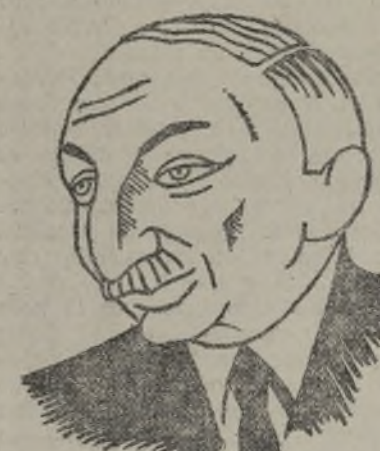
MR. DELBOS, QUE ANTE LA ASAMBLEA PROPUGNO POR EL MANTENIMIENTO DE LA PAZ

fe en la potencia de la S. de N., y declara que es importante mantener en el orden del día el problema del Desarme. Pide que todos los gobiernos acepten la publicidad de los presupuestos y llaman finalmente la atención sobre la útilísima obra de la S. de N. en favor de los refugiados políticos, citando a este propósito a Francia, como ejemplo para los demás Estados.