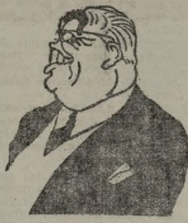
AGA-KHAN, QUE PRESIDIO LA SESIÓN

No hay solución posible al problema de España más que amoldándonos todos a una nueva práctica de convivencia social basada en los hechos. Sin abandonar nuestras ideas emancipadoras tenemos que dejarlas al margen para liberarnos de un peso que dificulta nuestra asunción. Por ahora ganará el más fuerte y el que menos obstáculos interponga. La capacidad revolucionaria de las masas españolas va a consistir en la facilidad con que nos disciplinemos todos.