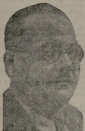
EL DOCTOR NEGRIN, CUYO DISCURSO HA SIDO CALIFICADO DE SENSACIONAL

Mi Gobierno, como desea ardientemente la paz entre todos los pueblos, busca los mejores medios de asegurarla. La suma de nuestras energías (de Francia e Inglaterra) es superior a toda otra potencia.