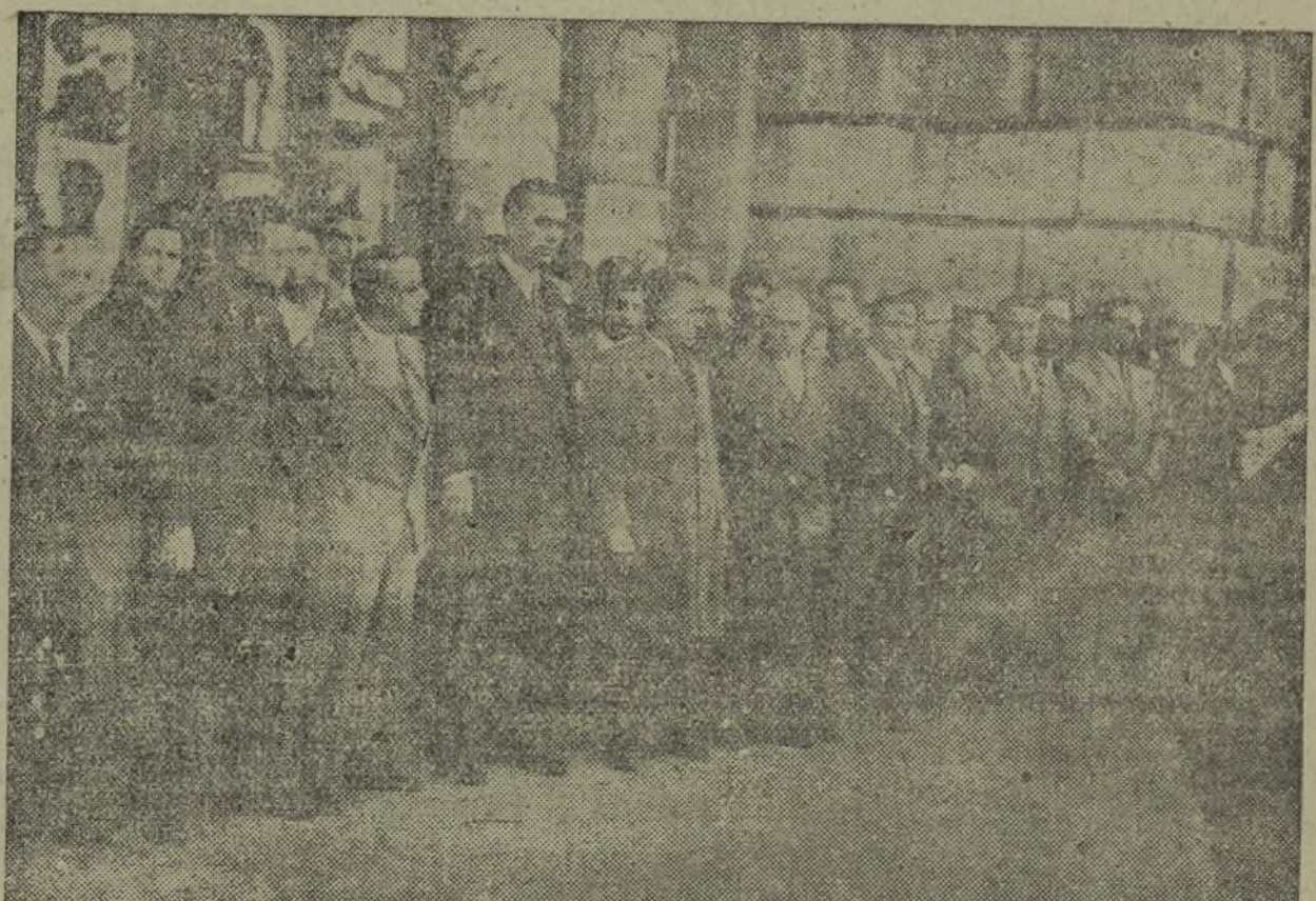
LA PRESIDENCIA DE LA MANIFESTACION DE DUELO EN LA QUE FIGURA EL PLENO DEL COMITE NACIONAL DEL PARTIDO

La aviación facciosa vuela sobre los arrabales de Madrid Y nuestros cazas le impiden sus propósitos