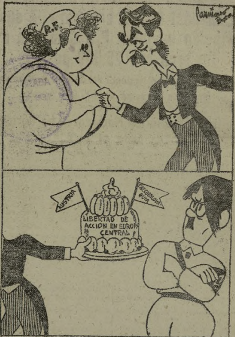
DESPUES DEL BANQUETE OFICIAL SIR CHAMBERLAIN LE TIENE RESERVADO A MARIANA ESTE POSTRE