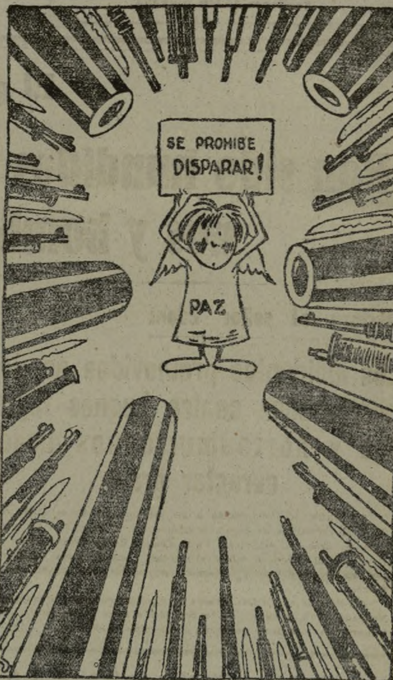
¡COMO SE VE LA PAZ!

El señor Delbos saldrá mañana por la noche para Praga.—FABRA.