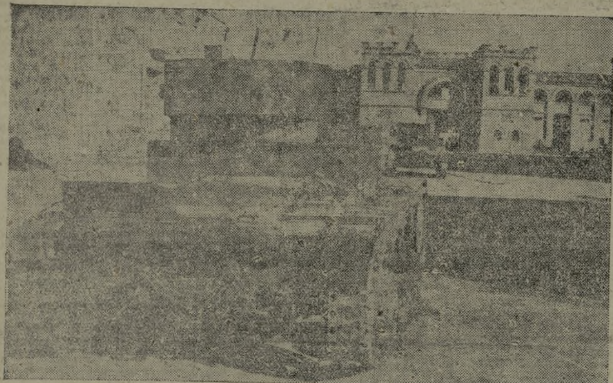
LOS TANQUES REPUBLICANOS, DECIDIDOS, AVANZAN HACIA LA PLAZA DE TOROS DE TERUEL.

Nuestros cazas derribaron e incendiaron un hidro procedente de Palma de Mallorca