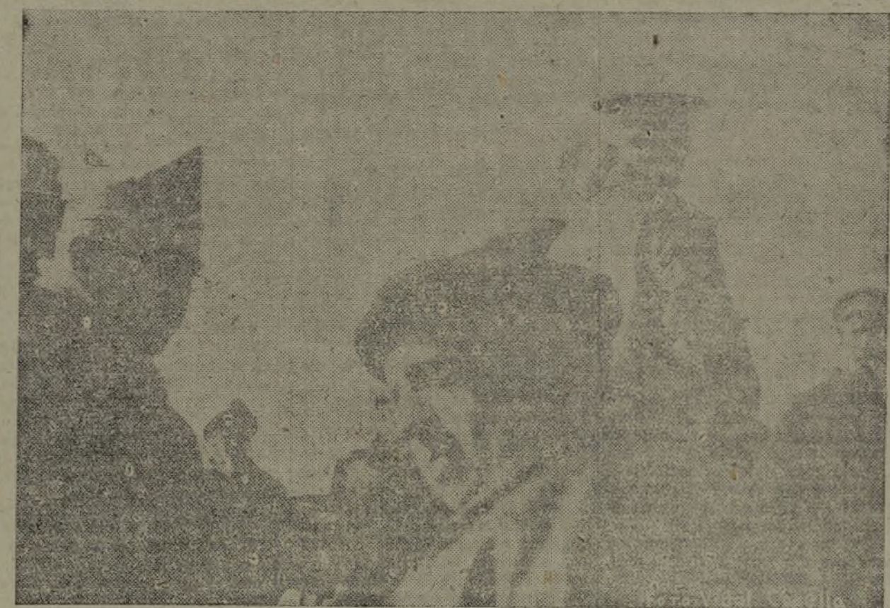
EL MINISTRO DE DEFENSA, SEÑOR PRIETO, EN UNA DE SUS VISITAS AL FRENTE DE LEVANTE.

lizando sus propósitos humanitarios en la ocupación de Teruel. Hoy han sido enviados otros tres emisarios a los contados rebeldes que aún resisten en los edificios de la Diputación, Banco de Es-