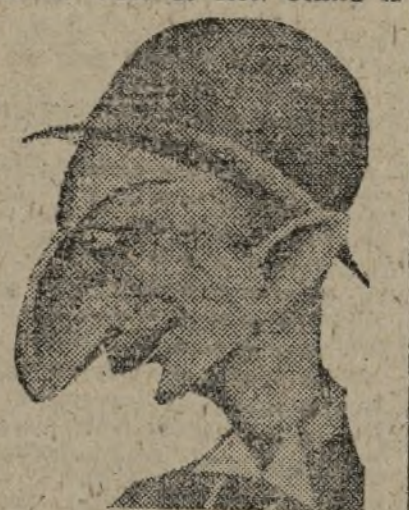
El señor Bonnet, ministro de Hacienda dimitionario, que ha sido encargado por el presidente Lebrun de formar Gobierno.

que figuren partidos y hombres que no prestaron el juramento de 14 de Julio de 1935. Contra la