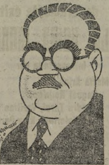
EL DOCTOR NEGRIN

«Profundamente conmovido de que en medio de sus grandes preocupaciones pueda encontrar espacio para enviarme su cariñoso mensaje a mi mujer y a mí en nuestras bodas de oro, desde el fondo de nuestro corazón los deseamos que la victoria corone sus gloriosos esfuerzos para establecer la libertad democrática y la justicia social en España.»