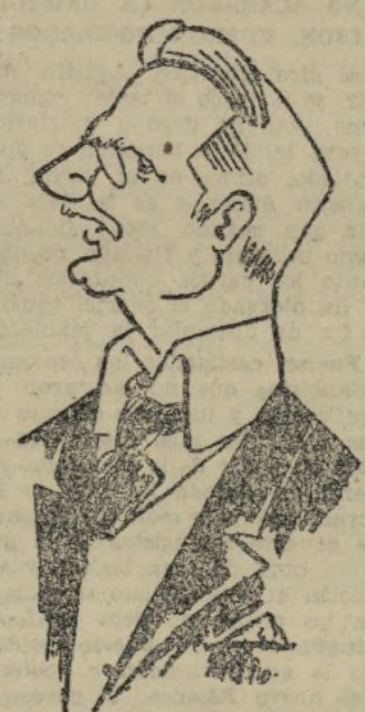
EL DOCTOR SCHAACH, EL ECONOMISTA DEL III REICH AL QUE HITLER HA DESTITUIDO NOMBRANDO PARA SUSTITUIRLE A FUNK

vertencia contra un nombramiento de este género que se hace problemático.