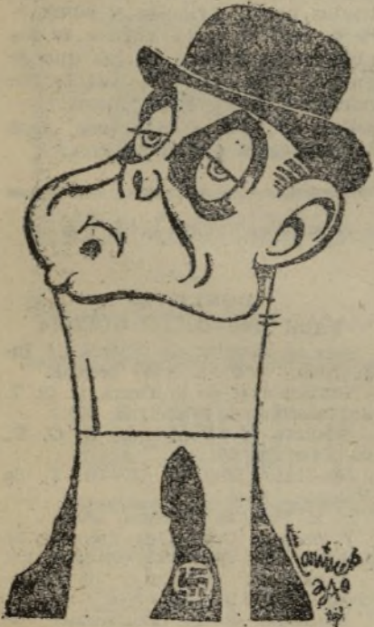
VON RIBBENTROP, EMBAJADOR DE HITLER EN LONDRES, QUE HA SIDO LLAMADO A BERLIN

A las siete de la mañana, todos los ocupantes del bote fueron recogidos por el pesquero «Salvador».