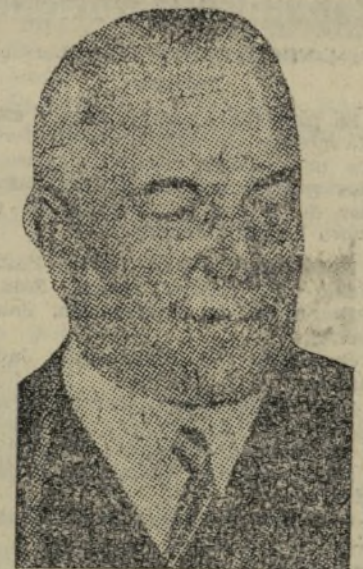
VON NEURATH, MINISTRO DE NEGOCIOS EXTRANJEROS DEL III REICH, QUE TAMBIEN HA DIMITIDO

El general von Brauchitsch se encarga de la dirección del ejército de tierra en sustitución del general von Fritsch. Este último y von Blomberg son considerados como disfuncionarios por razones de salud.