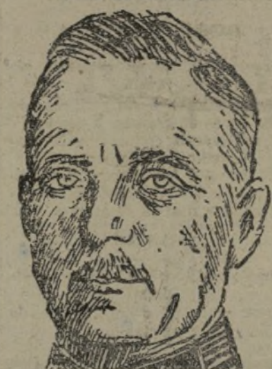
EL GENERAL KEITEL Ha sido nombrado jefe del mando supremo de todas las fuerzas militares del III Reich