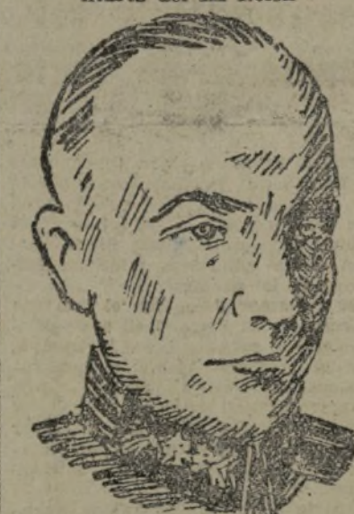
VON BRAUCHITSCH Sustituye a von Blomberg en la dirección del Ejército