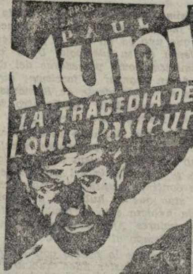
Habiada en español

Una película tan grande como el hombre que inmortaliza. Tan heroica como el hombre que sacrificó el amor y desahó a la muerte misma para rescatar a las mujeres de un reino invisible de terror.