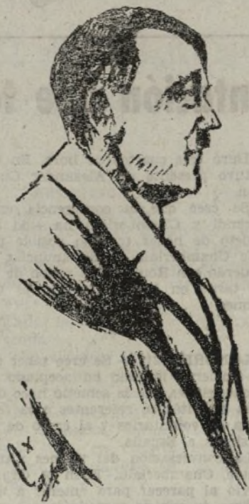
HITLER HA DESAFIADO AL MUNDO. CONFÍA QUE LE AYUDARÁN ITALIA Y EL JAPÓN. Y CON ESTAS COLABORACIONES SE HA DECIDIDO A EJECUTAR A LAS DEMOCRACIAS Y A EXPRESAR SU ODIOS A LA PAZ Y A LA CIVILIZACIÓN

«El Daily Herald» publica una fotografía de Chamberlain con el siguiente pie: «Chamberlain se dispone a entregar todo aquello en que la opinión inglesa tiene fe».