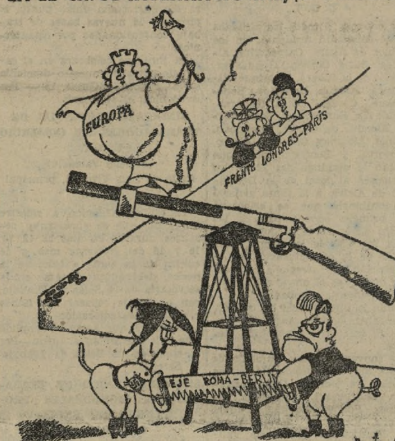
ADOLFO. — SIGUE, BENITO: QUE LAS DEMOCRACIAS NO SE ENTERAN DE NADA.

EN EL CIRCO INTERNACIONAL, por CARNICERO.