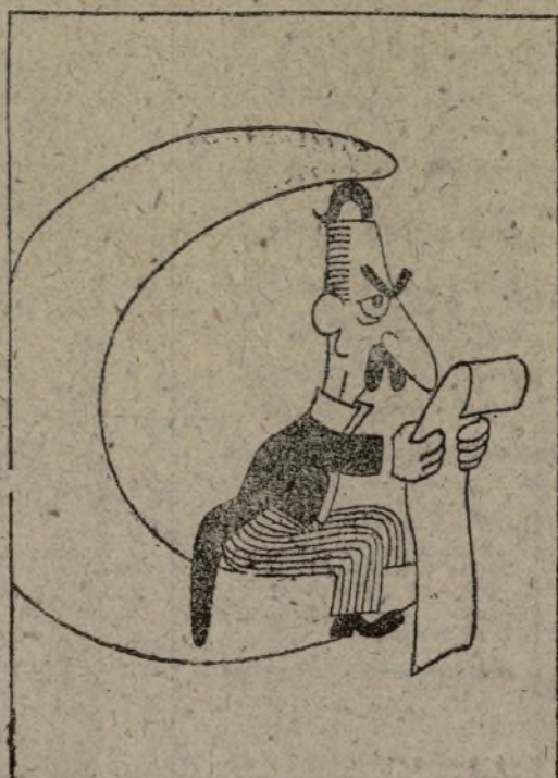
CHAMBERLAIN, EN LA LUNA