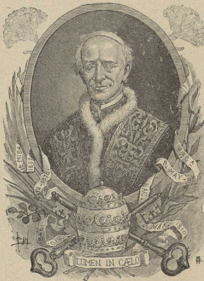
Muestra de los grabados de "Los Deberes de los niños," Edición Calleja.

MÉTODO DE LECTURA CONFORME CON LA INTELIGENCIA DE LOS NIÑOS