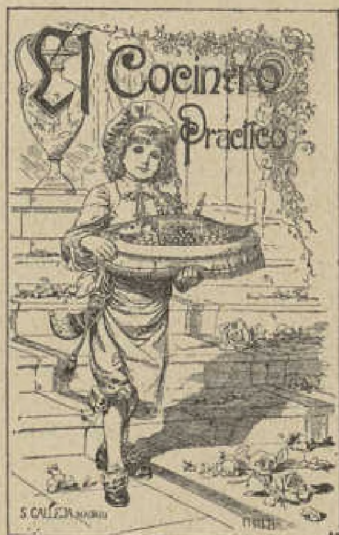
Plancha (reducida) que se emplea para la encuadernación en tela de El Cocinero práctico.

El Cocinero práctico , nuevo tratado de cocina repostería y pastelería, con interesantes artículos de economía doméstica y horticultura. Describe minuciosamente el servicio de la mesa, el arte de trincar y todo lo referente á la cocina económica y á la de lujo de todos los pueblos civilizados. Contiene gran número de interesantes fórmulas de fácil ejecución, recomendadas por los más afamados cocineros, el arte completo del pastelero y repostero, un manual de economía doméstica en que se expone la manera de conservar las substancias animales y vegetales, dirigir la matanza y salazón del cerdo, reconocimiento de las carnes triquinadas, elaboración del pan, práctica del lavado y planchado, etc. etc., terminando con un completo tratado de floricultura.