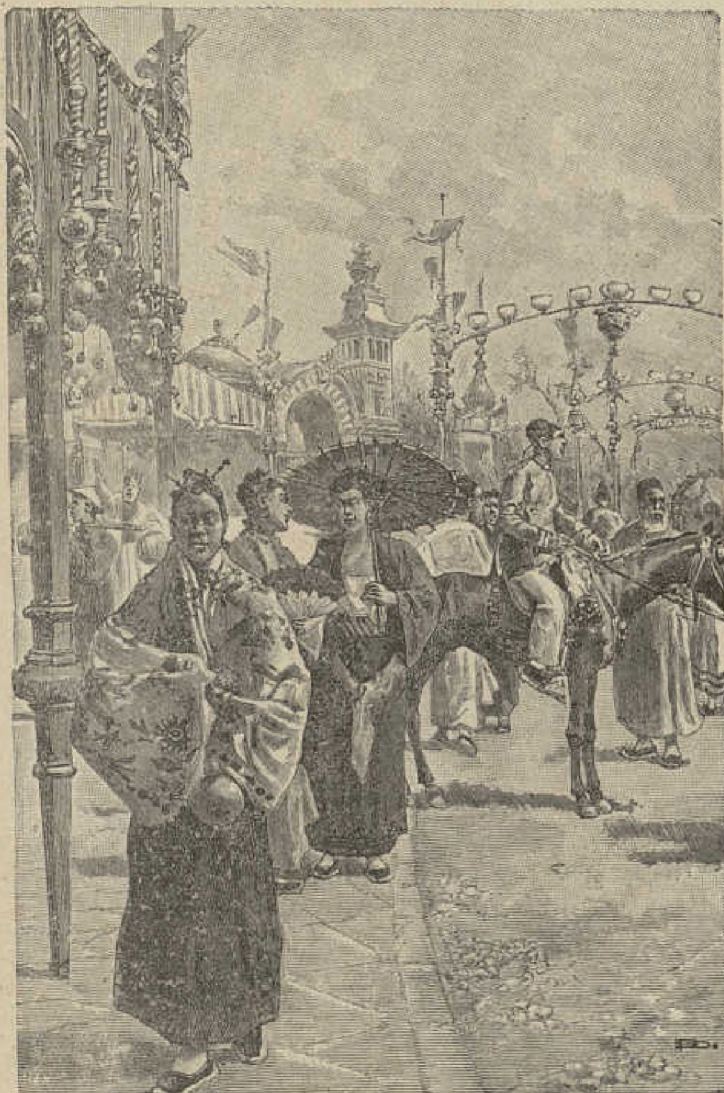
Muestra de los grabados de «Las Mil y una noches», de la Casa Calleja.