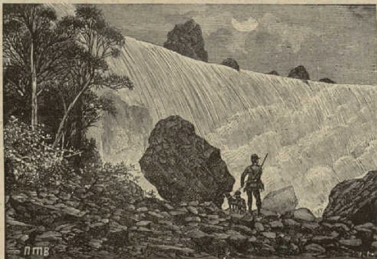
Muestra de los grabados del «Método de primera enseñanza cíclica» de la Casa Calleja.

TIENEN LA APROBACIÓN DE LA AUTORIDAD ECLESIASTICA Y DEL CONSEJO DE INSTRUCCIÓN PÚBLICA