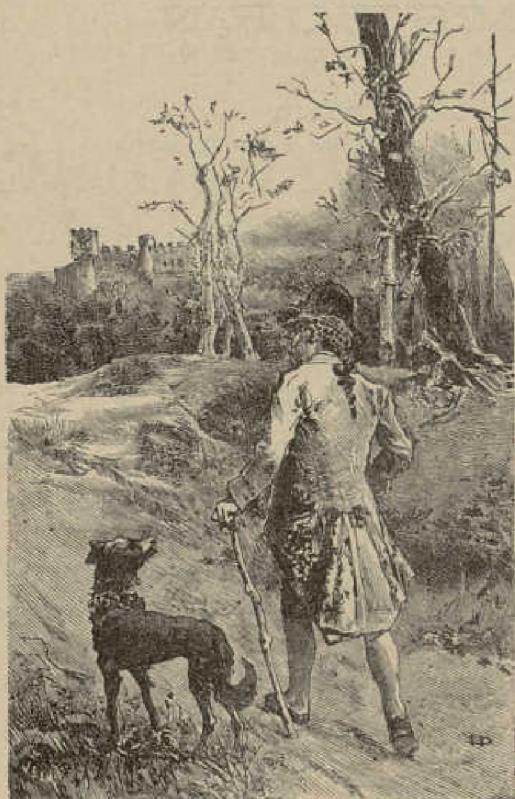
Muestra de los grabados de los «Cuentos Grimm», edición Calleja.