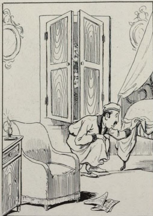
Y la verdad es, que tengo una cosa así, como si fuese miedo y quiero convencerme...