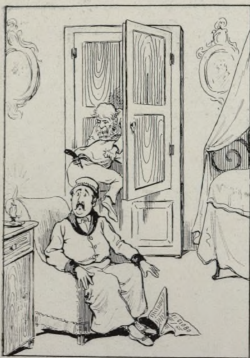
¡Me ha parecido oír ruido en la habitación!