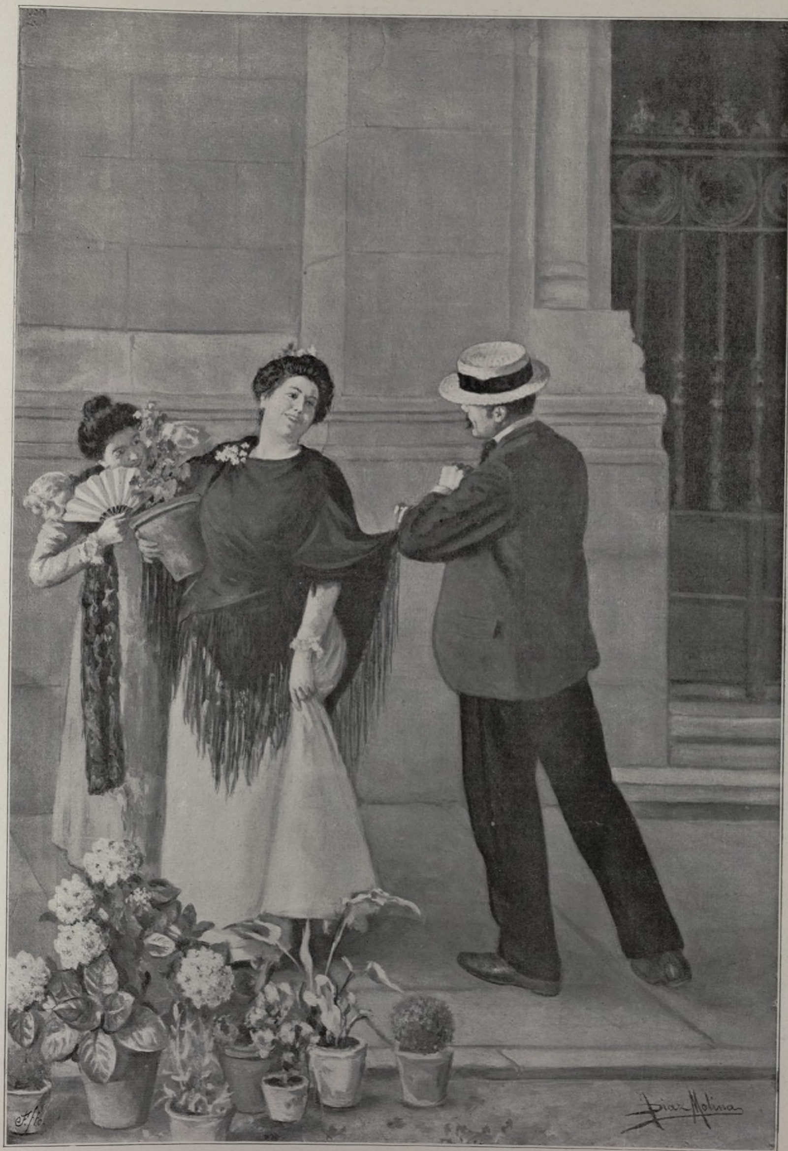
UN ENREDO PELIGROSO