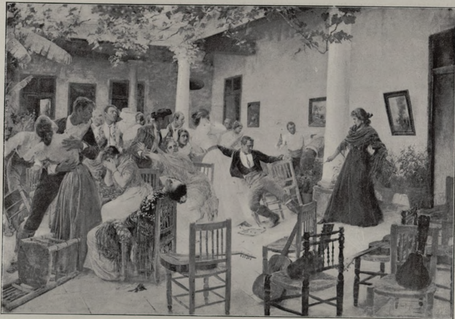
LA VENGANZA DE LA LOLA