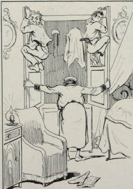
Efectivamente estoy solo.