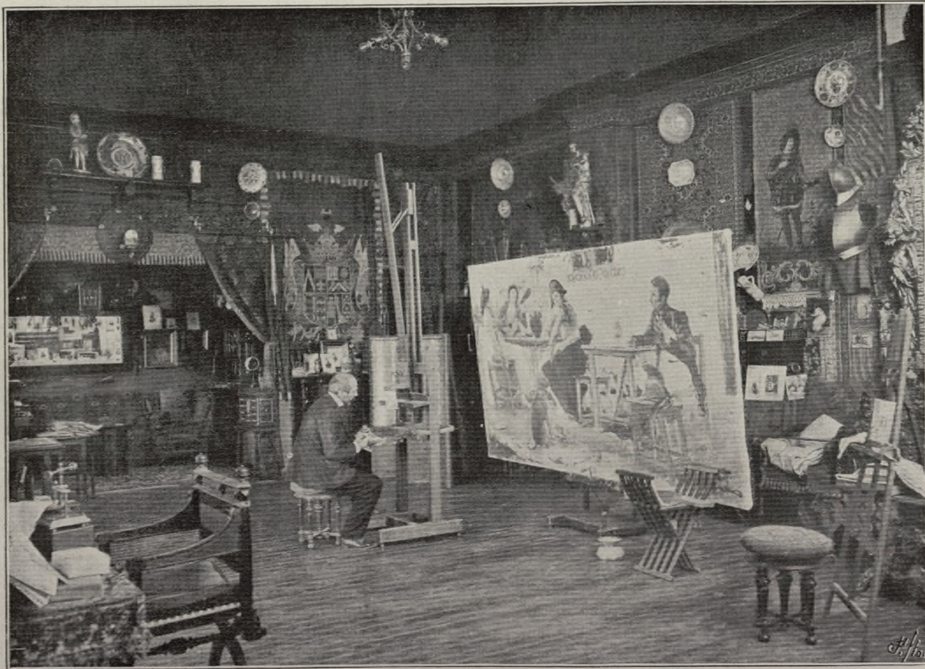
EL PINTOR Y LITERATO SAINT-AUBÍN, EN SU TALLER DE MADRID.