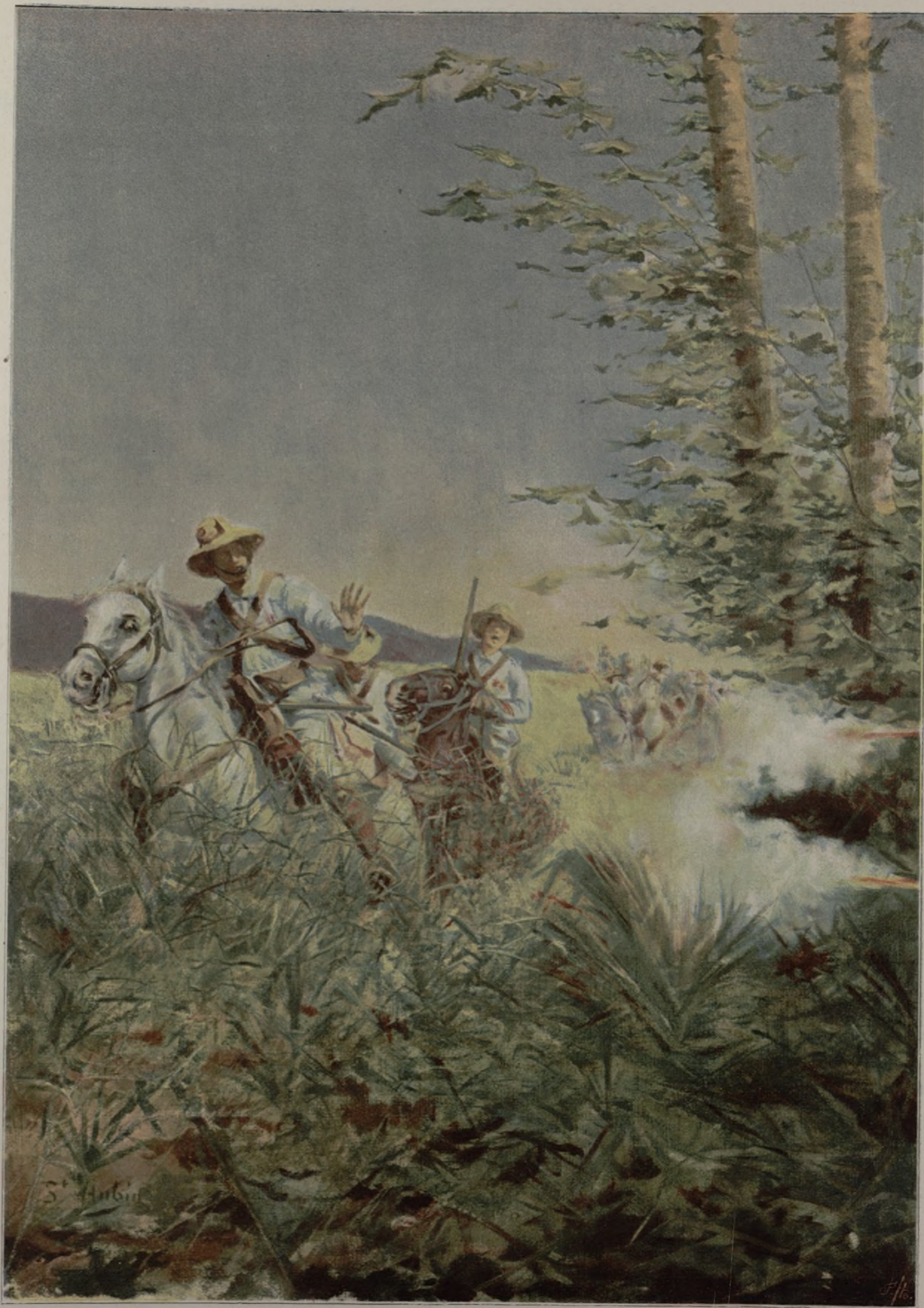
UNA EMBOSCADA EN LA MANIGUA