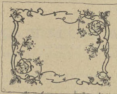
LABOR EMPEZADA DEL MES DE DICIEMBRE Tapete de paño gris 41 x 45.

Además, la administración de La Mujer en su Casa procura á las señoras suscriptoras, á un precio sumamente económico, empezadas y con todo el material necesario para hacerlas, todas las labores que van descritas en el periódico y de las cuales siempre tiene existencias.