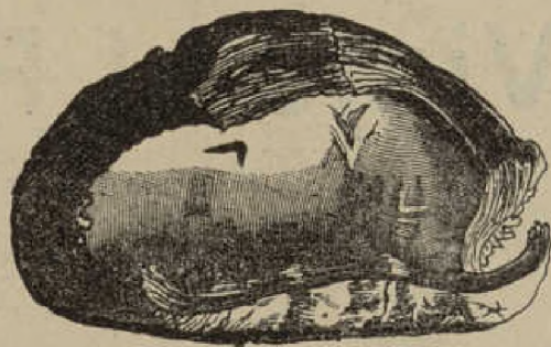
Parte de una bolsa de equinococos del hígado con los bordes arrollados. La membrana está engrosada é infiltrada. El contenido de la bolsa estaba supurado.

Esta obra forma cuatro tomos en 4.º mayor, ilustrados con multitud de excelentes grabados. Se publica por cuadernos de 48 páginas, impresas en papel glaseado, y se reparten uno ó más semanalmente. También puede servirse la obra completa.