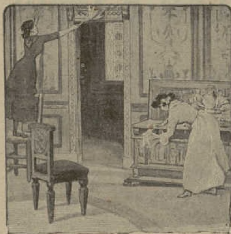
Muestra de los grabados que ilustran la obra.

CONSTITUYE EL TOMO XXIV DE LA NOTABLE Y ELEGANTE COLECCIÓN ELZEVIR ILUSTRADA