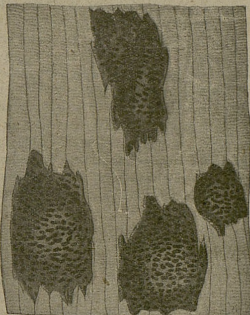
Fig. 5.º—Cristales de tirosina vistos al microscopio.

la tirosina representa una escisión de la proteína, escisión que puede ser el resultado, o de una autólisis postmortal, o de una fermentación microbiana; sostiene la hipótesis de que los cristales de tirosina en las carnes conservadas son producto de una autólisis muscular ocurrida durante la conservación, especial-