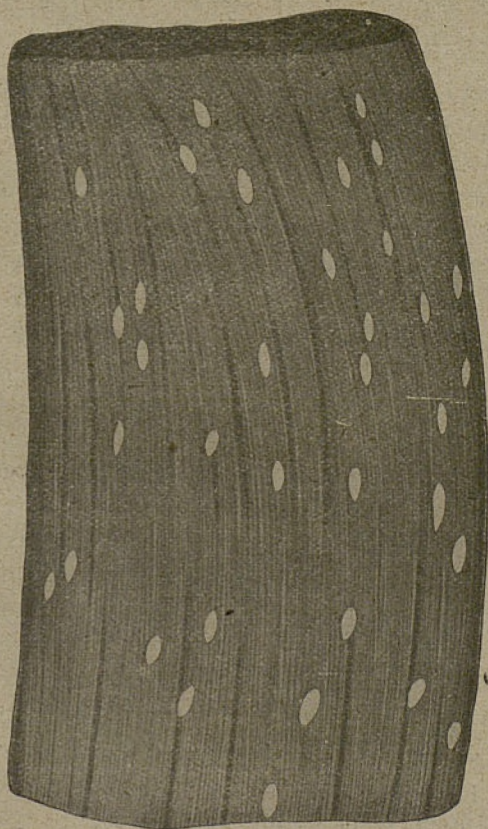
Fig. 4.º—Trozo de músculo con psorospermiosis calcificada; disposición simétrica de los parásitos a lo largo de la fibra muscular.

la tirosina representa una escisión de la proteína, escisión que puede ser el resultado, o de una autólisis postmortal, o de una fermentación microbiana; sostiene la hipótesis de que los cristales de tirosina en las carnes conservadas son producto de una autólisis muscular ocurrida durante la conservación, especial-