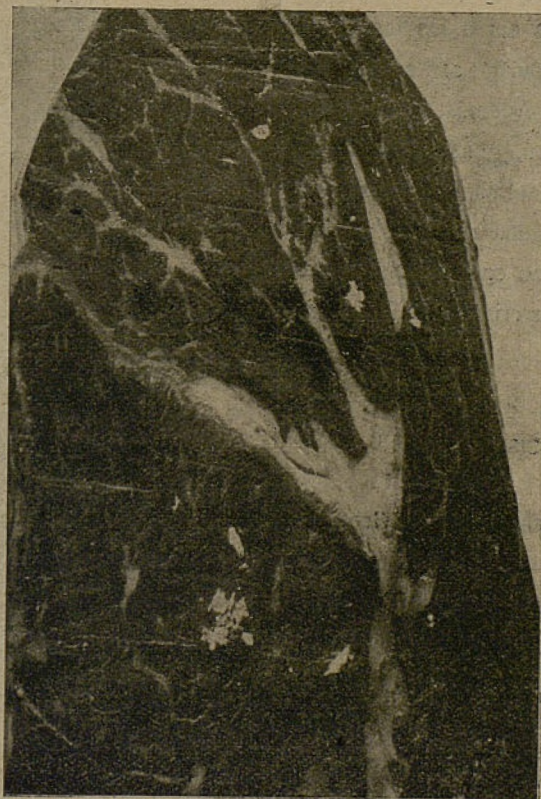
Fig. 1. a —Muestra de jamón serrano con pintas de tirosina; las manchas blancas irregulares se destacan perfectamente del tejido graso interfascicular.

Cuando la calcificación afecta sólo a la membrana de envoltura es fácil poner en evidencia la cápsula y el parásito, con sólo adicionar algunas gotas de ácido acético o clorhídrico diluido. En estas condiciones, la forma alargada de las concreciones calcáreas y sus dimensiones, que no pueden exceder de medio a un centímetro, su situación en el interior de las fibras musculares y la presencia de tejidos adiposos en los dos polos, son señales que permiten suponer la triquinosis (fig. 2. a ).