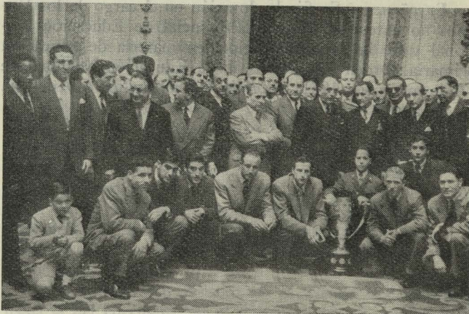
El Alcalde con los directivos y jugadores del Atlético de Madrid en el acto de la entrega del trofeo conquistado en el campeonato de Liga