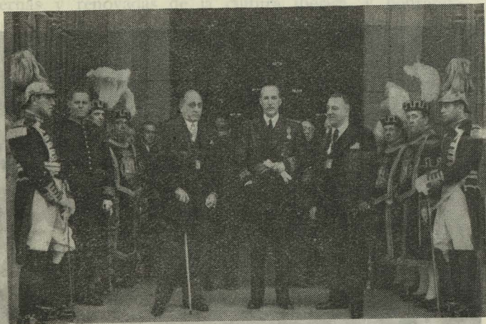
El Ministro de Agricultura, D. Carlos Rein; el Alcalde de Madrid, Conde de Santa Marta de Babío, y el Vicepresidente de la Diputación, Marqués de Vivel, saliendo de la Catedral después de la misa de pontifical celebrada el día de San Isidro.

— Desde allí se trasladó el Alcalde y la casi totalidad de los Concejales a la inauguración del Museo Taurino,