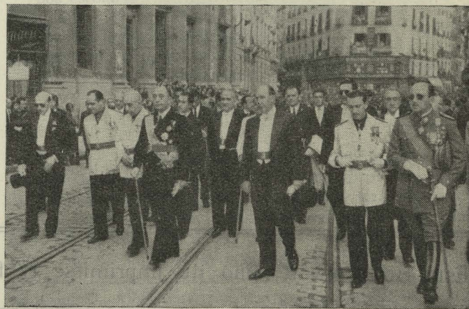
El Ayuntamiento en Corporación en la presidencia de la procesión del Santísimo Corpus Christi