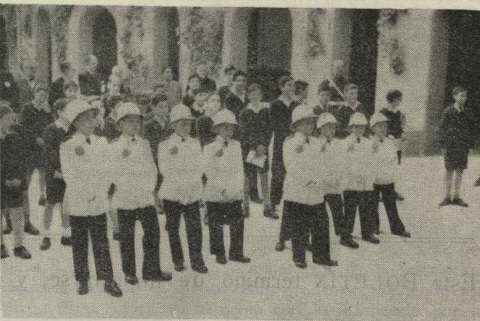
Los niños del Internado municipal de San Ildefonso que formaron la Brigadilla de Circulación en el festival infantil celebrado en el Retiro

El Ministro de Obras Públicas, señor Fernández Lareda, pronunció unas palabras destacando la importancia de esta bella restauración, agradeciendo las colaboraciones que en esta obra se habían recibido hasta llegar este momento por el Ayuntamiento y el Consejo de la Canalización del Manzanares, y después de exponer el lamentable estado en que quedó la ermita a consecuencia de la devas-