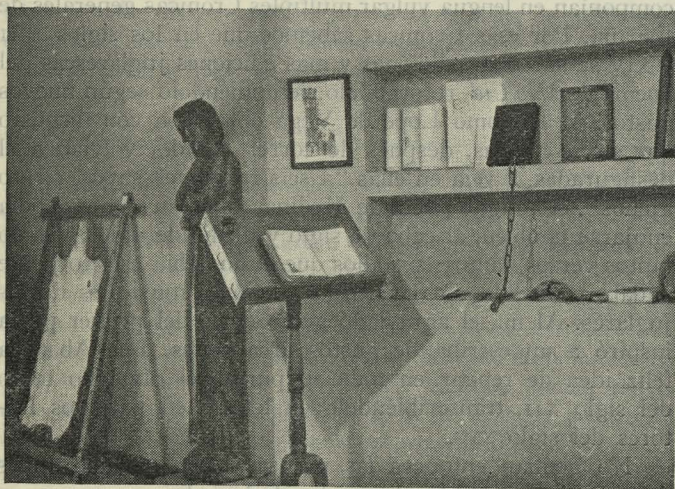
Interior del pabellón donde fueron expuestos el Poema del Mio Cid y el Diario del Alcázar