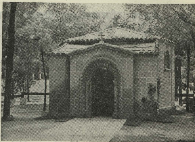
Pabellón del excelentísimo Ayuntamiento en la FERIA del Libro

No gemían entonces las prensas para producir miles de ejemplares; gemía el copista, deslomado semanas y semanas, meses y meses, sobre las pautas del pergamino, para producir una sola copia, y al acabarla, expresaba en alguna frase final la sensación de alivio que experimentaba al lle-