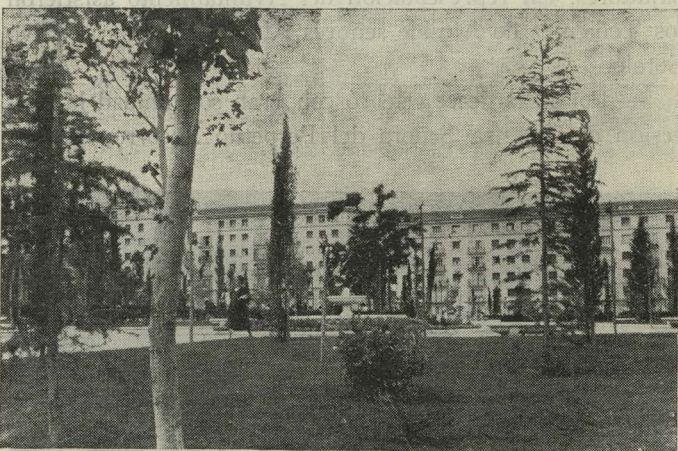
Parque Municipal Eva Duarte de Perón, en la plaza de Manuel Becerra

Paralelamente a la ejecución de los trabajos de la segunda etapa, se construyó el cerramiento del Parque, para lo que ha sido preciso demoler las ruinas del antiguo cerramiento, desalojar a una familia que vivía en los restos de las primeras demoliciones y variar el emplazamiento del transformador corriente, trasladándolo al nuevo construido.