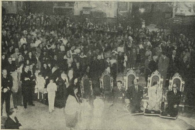
Aspecto que ofrecía la iglesia de San Francisco el Grande en la ceremonia de la Primera Comunión de los niños de los Internados de Nuestra Señora de la Paloma

—Por la tarde se celebró con gran solemnidad la procesión de Nuestra Señora del Perpetuo Socorro, que re-