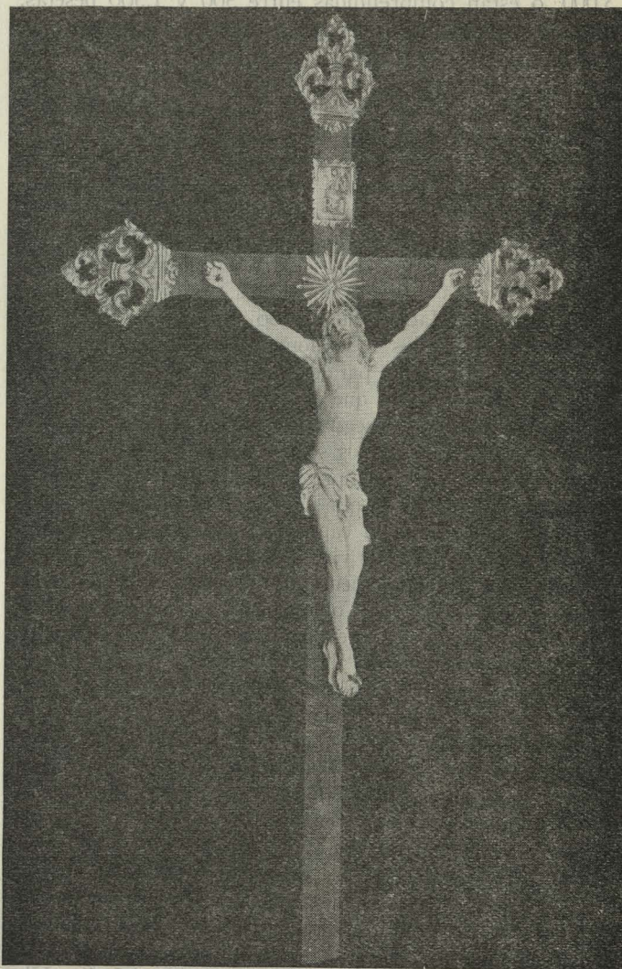
Artístico Cristo de marfil que, a propuesta de la Comisión de Cultura, ha adquirido el Ayuntamiento y que quedará expuesto en una hornacina del salón de Retratos donde se halla la Custodia procesional de plata.

Tres clavos sostienen a nuestro Cristo, siguiendo en esto la tradición artística más difundida. Pues aunque San Gregorio de Tours y otros autores afirman haber sido crucificado Jesús con cuatro clavos, siempre ha sido éste un tema de libre interpretación artística. Cuatro clavos tiene la mayoría de los crucifijos bizantinos y románicos. Y sin embargo, el que Don Jaime el Conquistador regala al Monasterio del Puig, en Valencia, sólo tiene tres, a pesar de estar realizado en el siglo XIII... Tres tienen los Cristos renacentistas y barrocos, lo que no impidió a Velázquez pintar cuatro en el suyo... De todos modos, pintores, es-